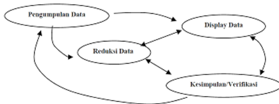
Gambar 3.2 Model Interaktif dalam Analisis Data

Gambar diatas menunjukkan langkah-langkah yang ditempuh dalam analisis data menurut pandangan Matthew B. Miles dan A. Michael Huberman (2009, hlm. 16-21) yaitu sebagai berikut: