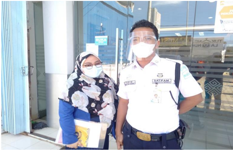
3. Foto bersama Nasabah bank BNI Syariah KCP Sungai Danau