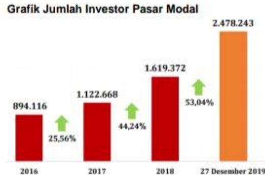
Gambar 1.1 Grafik Pertumbuhan SID Tahun 2014-27 Desember 2019