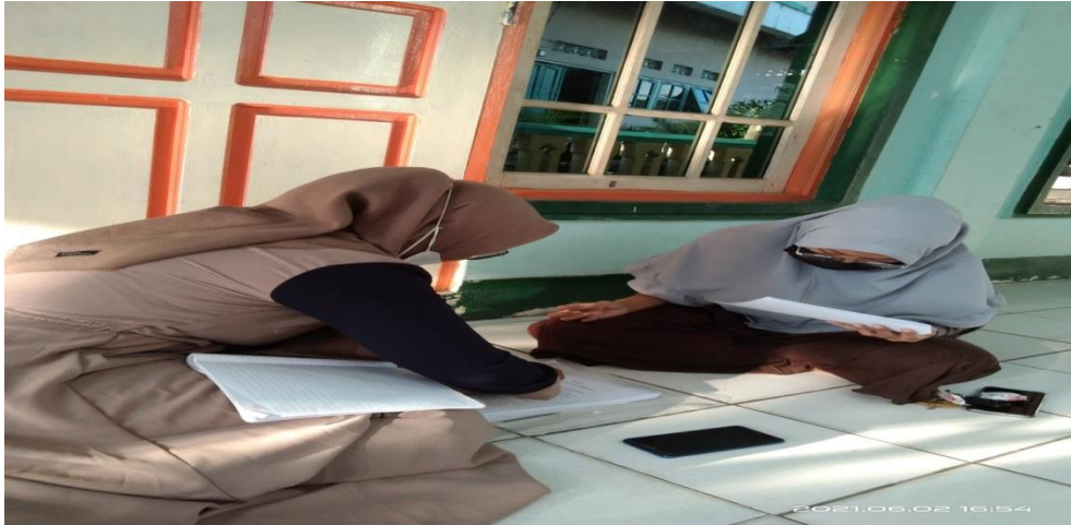
Foto Gedung TK/TPA Unit 191 Al-Inayah Banjarmasin