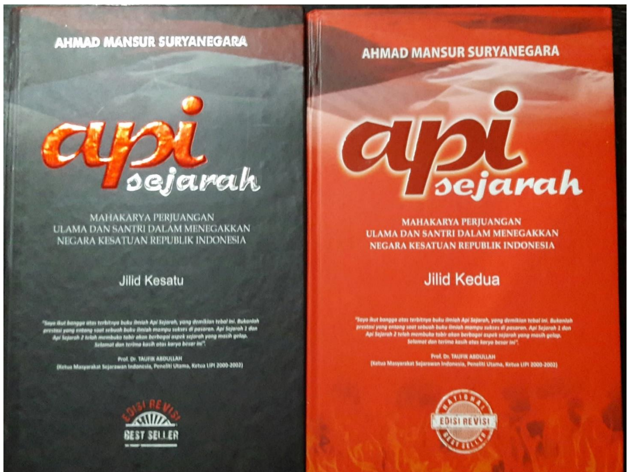
Cover Depan Buku Api Sejarah