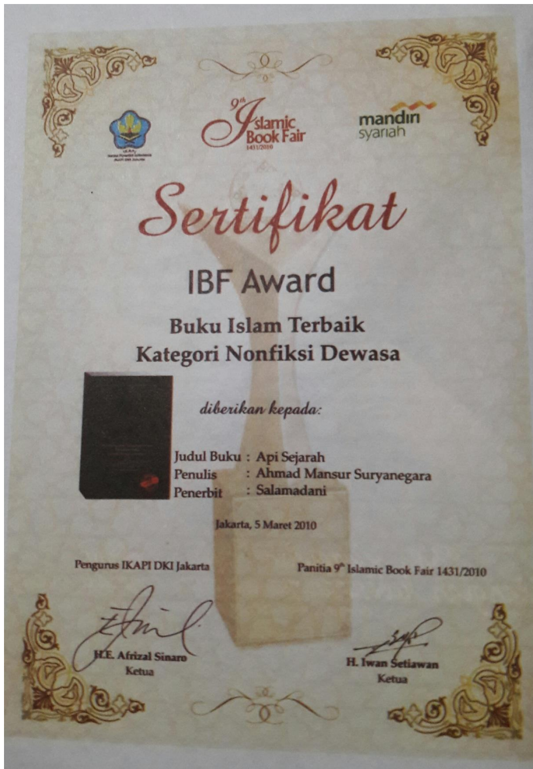
Piagam Penghargaan Buku Api Sejarah