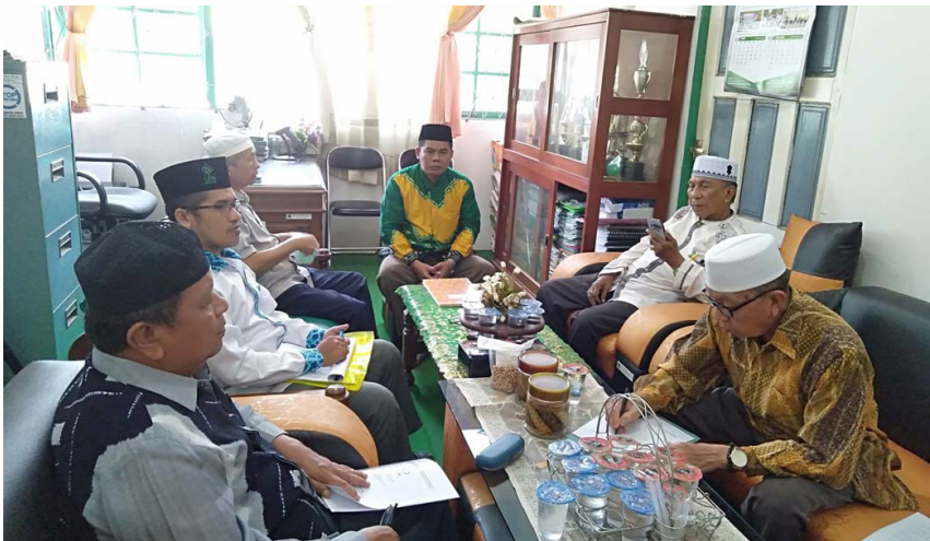
Kegiatan peneliti berdialog dengan pengurus MUI Kabupaten Baritor Kuala dan tokoh masyarakat di ruang kantor Kementerian Agama di kota Marabahan