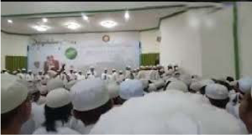
Peneliti dan segenap pembantu peneliti ikutserta dalam kegiatan Majelis Dzikir an Nafs Musyahadah Nur Insan Kamil Pernapasan Istiqna (NIKPI) pada bulan Ramadhan tahun 1440 H di Aula Asrama Haji Banjarbaru