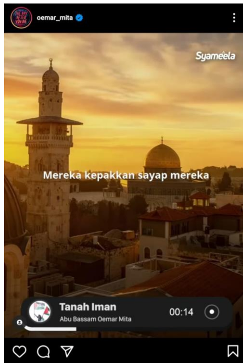
Gambar 4.3 Tampilan postingan video