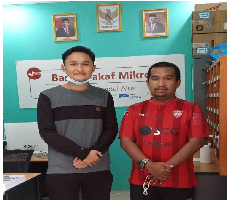
Dokumentasi wawancara nasabah BWM Cindai Alus