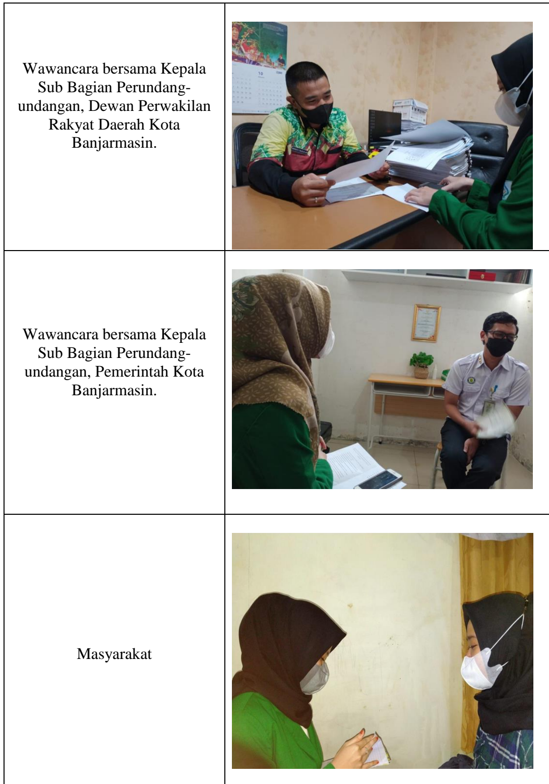
Foto – foto penelitian