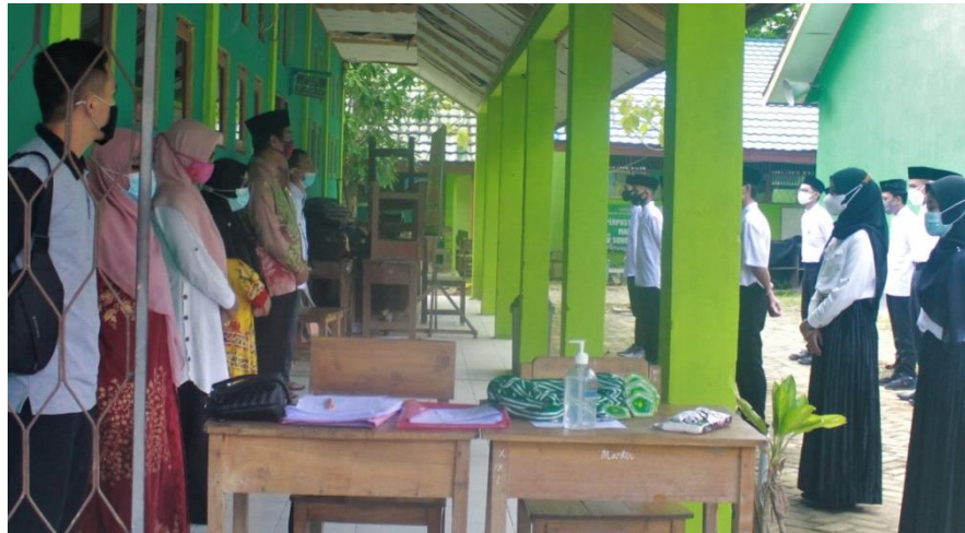
Gambar Kepala Madrasah Memberikan Motivasi dan Arahan Kepada OSIS