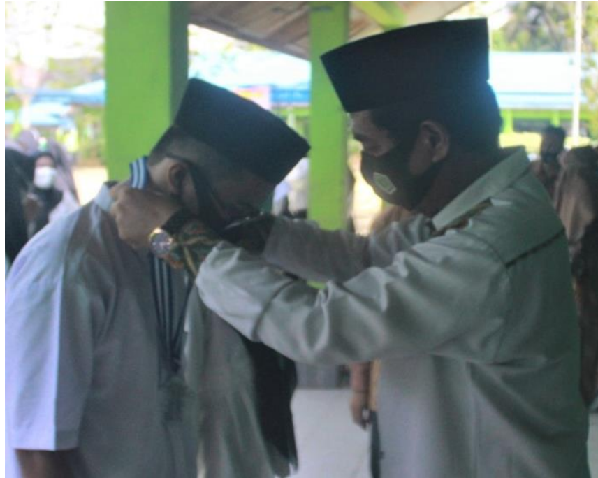
Gambar Kepala Madrasah Melakukan Pelantikan OSIS