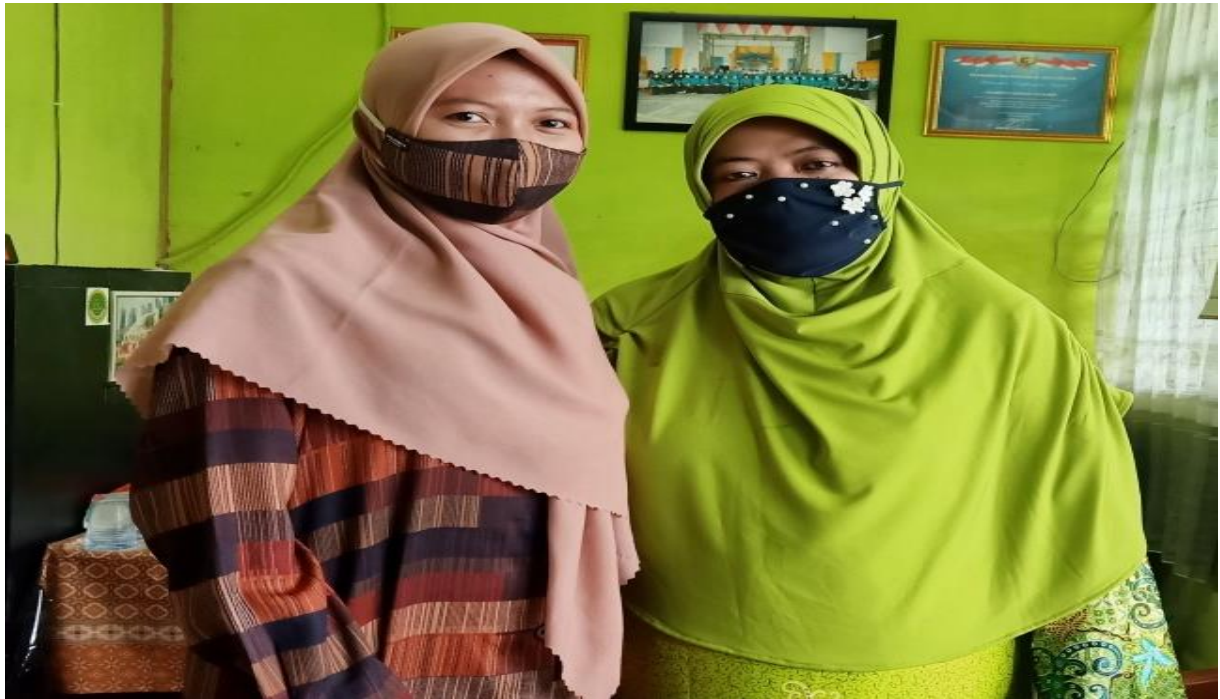
Wawancara Dengan Perwakilan Staf Administrasi (Tata Usaha)