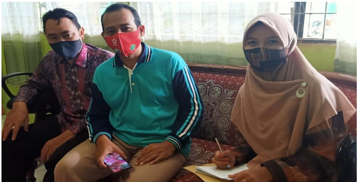
Wawancara Dengan Wakil Kepala Madrasah Bidang Humas & Kesiswaan