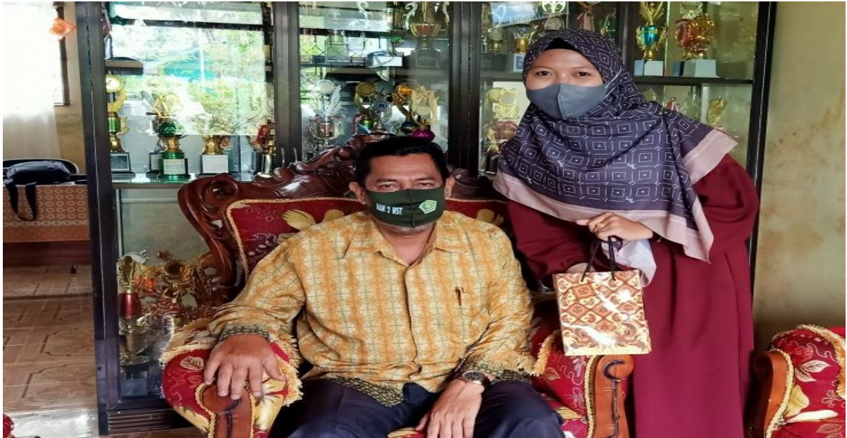
Wawancara Dengan Kepala Madrasah