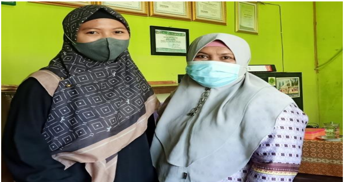
Wawancara Dengan Salah Satu Tenaga Pengajar (Guru)