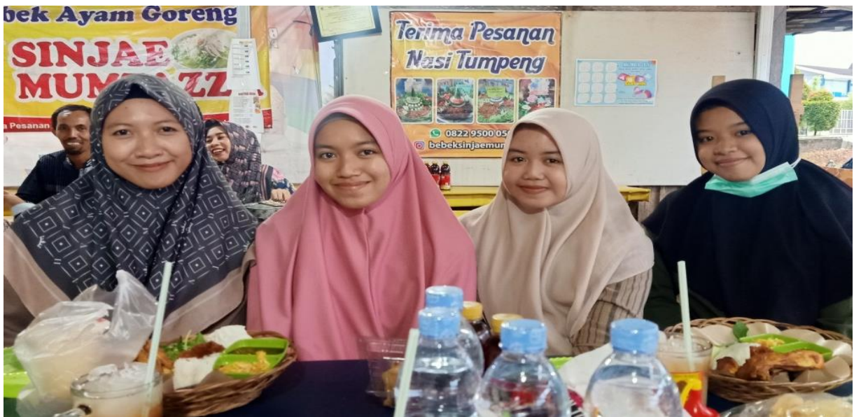
Wawancara Dengan Beberapa Siswa dan Pengurus OSIS