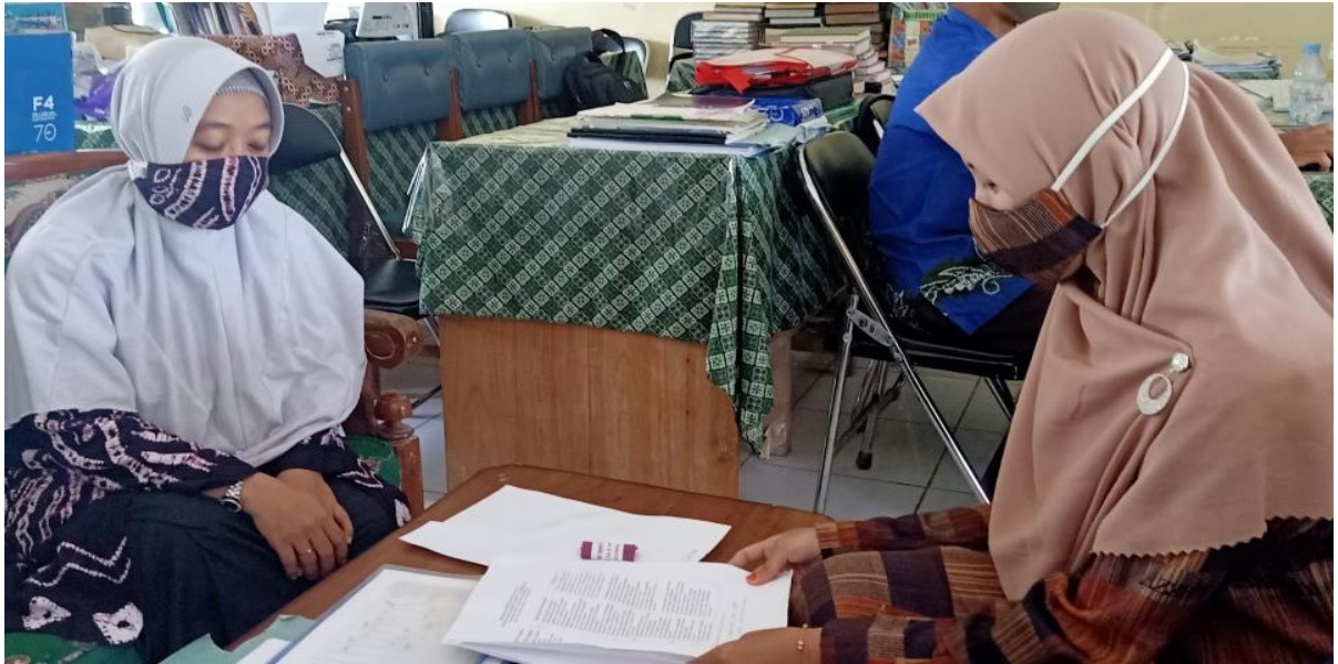
Wawancara Dengan Wakil Kepala Madrasah Bidang Kurikulum