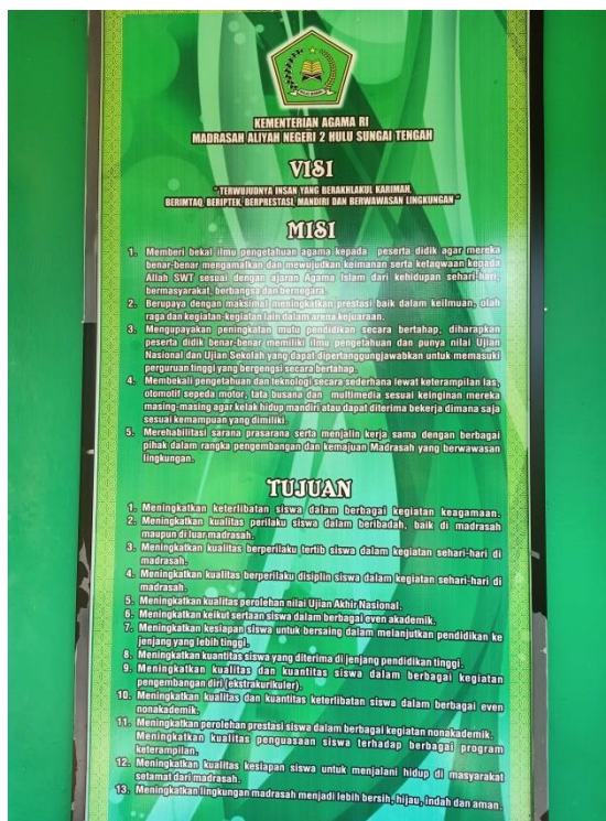
Gambar Visi, Misi dan Tujuan Madrasah MAN 2 Hulu Sungai Tengah