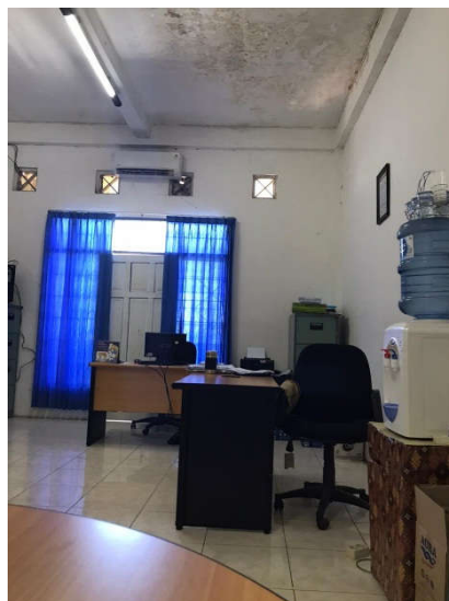
Foto Ruangan Marketing AO BRISyariah KC Kayutangi Banjarmasin