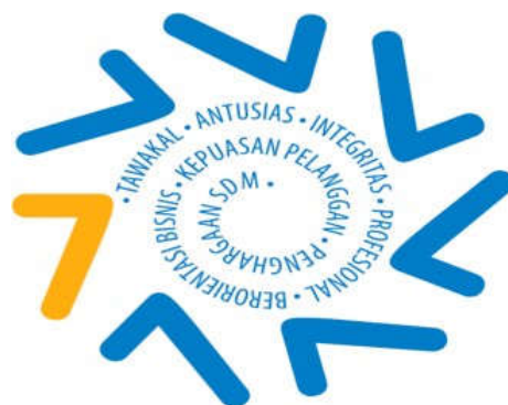
Gambar 1. Nilai-Nilai Utama Budaya Kerja Bank BRISyariah

Bank BRISyariah memiliki budaya kerja yang terdiri dari 7 nilai-nilai dasar dan 49 perilaku utama yang diterapkan terhadap setiap pegawai untuk mencapai visi dan misi dalam perwujudan Pasti Oke tersebut sebagai berikut: