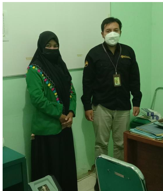
Wawancara Langsung Dengan Karyawan BPRS Bhakti Sumekar Kantor Cabang Gapura Sumenep ( Account Officer dan Customer Service )