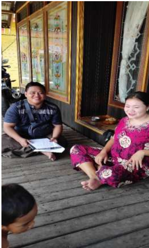
Itang, Kawin pada Usia 15 Tahun