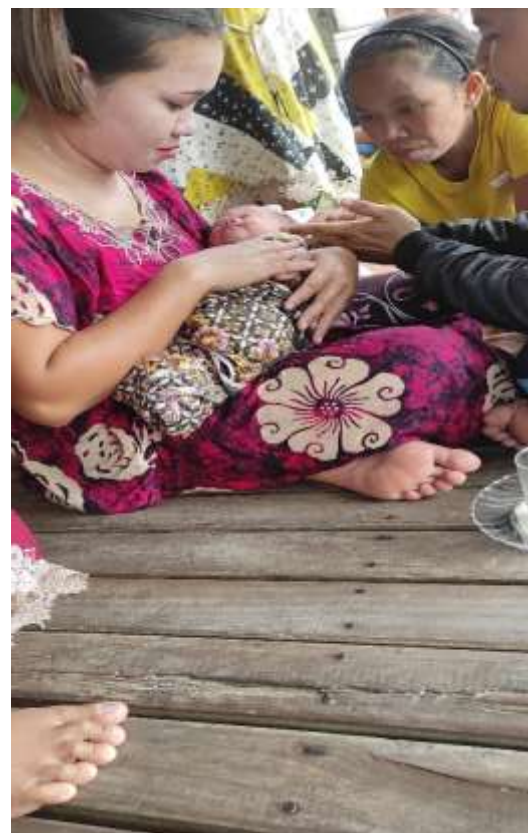
Itang dan anak ke duanya