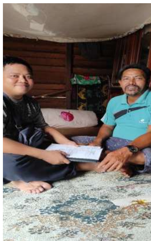
Orang Tua Nisah, Bapak Imuk