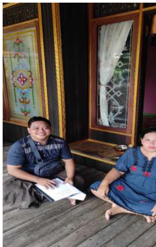
Orang Tua Rika, Ibu Aloh