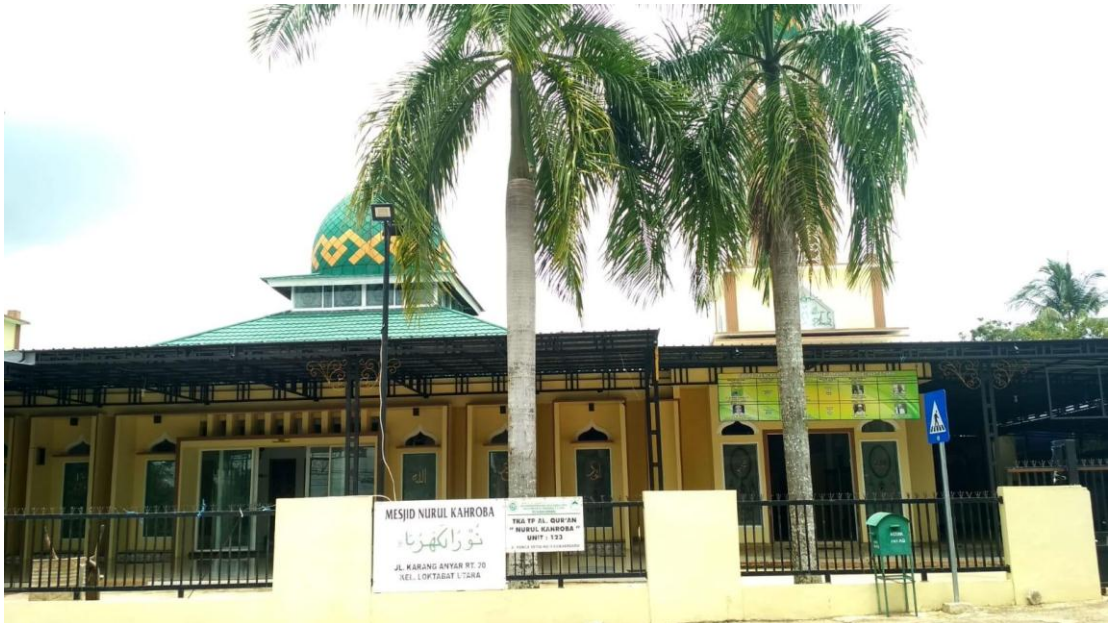
GAMBAR 5.1 Masjid Nurul Kahroba