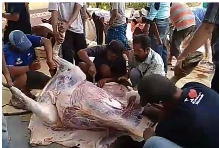
GAMBAR 4.9 Pemotongan hewan kurban di Masjid Nurul Kahroba Loktabat Utara Banjarbaru. Juli 2021

banyak yang memilih hewan sapi karena seekor sapi boleh dijadikan kurban untuk 7 orang. Layanan pendaftaran dibuka dari jam 08.00 pagi sampai jam 17.00 sore dan apabila jemaah yang mendaftar melebihi dari batas yang telah ditentukan maka akan ditransfer ke penyembelihan lain seperti PC NU dan masjid-masjid terdekat. Penyembelihan biasa dilakukan di halaman masjid dengan menyiapkan kupon 1.000 dengan mengutamakan masyarakat sekitar yang berhak menerima daging kurban. Strategi yang dilakukan pengurus masjid adalah dengan menjalin kerja sama dengan masyarakat sekitar dan mereka dapat ikut dalam kepanitiaan. Kendala yang dialami pengurus biasanya kewalahan dalam pemotongan karena masih dalam bentuk manual belum menggunakan mesin. 55