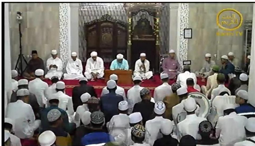
GAMBAR 4.8 Pengajian Habib Hafidz Al-Qodri di Masjid Nurul Kahroba Loktabat Utara Banjarbaru.