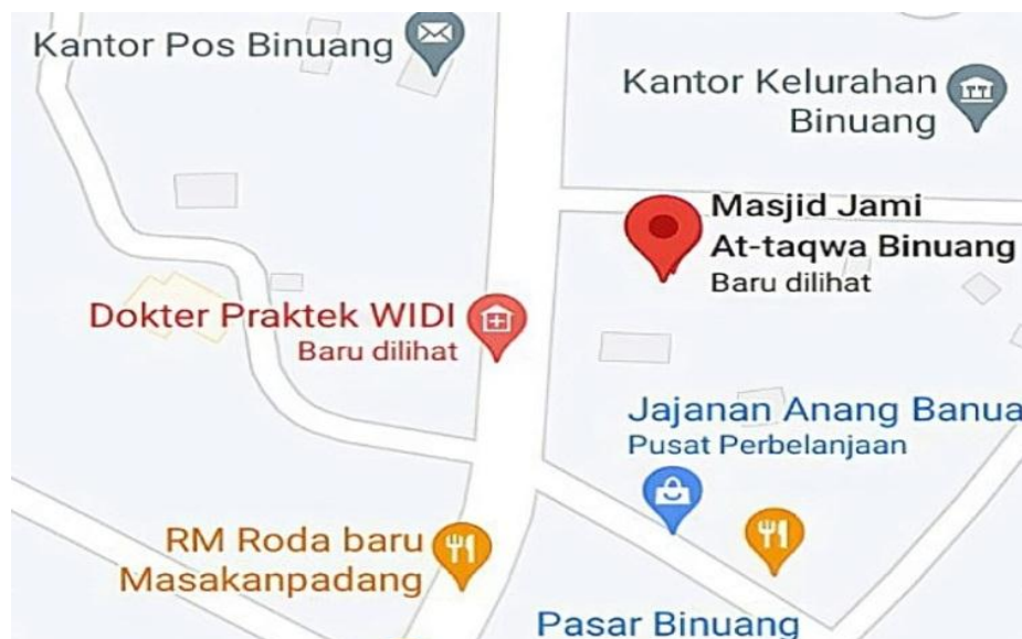
GAMBAR 4.1 PETA LOKASI MASJID AT-TAQWA BINUANG

jangkau dengan mudah oleh para Jemaah atau para musafir yang lewat karena letaknya di pinggir jalan raya tepat di tengah-tengah pemukiman masyarakat.