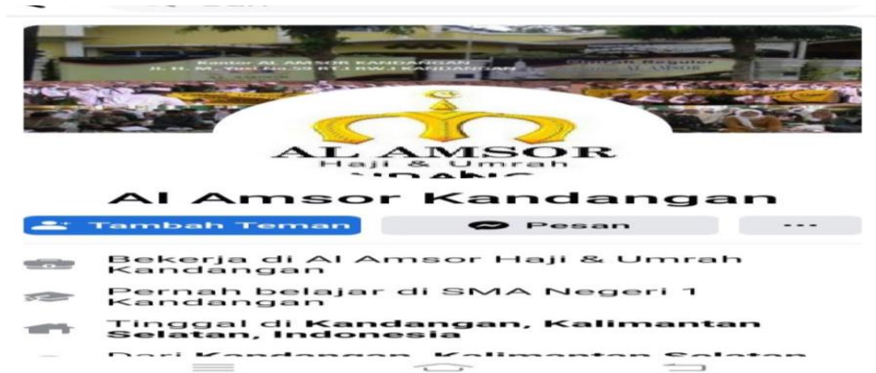
GAMBAR 4.4 Facebook PT. Al Amsor Mubarakah Wisata