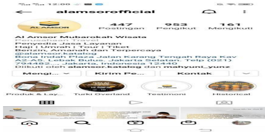
GAMBAR 4.5 Instagram travel haji dan umrah PT. Al Amsor Mubarakah Wisata