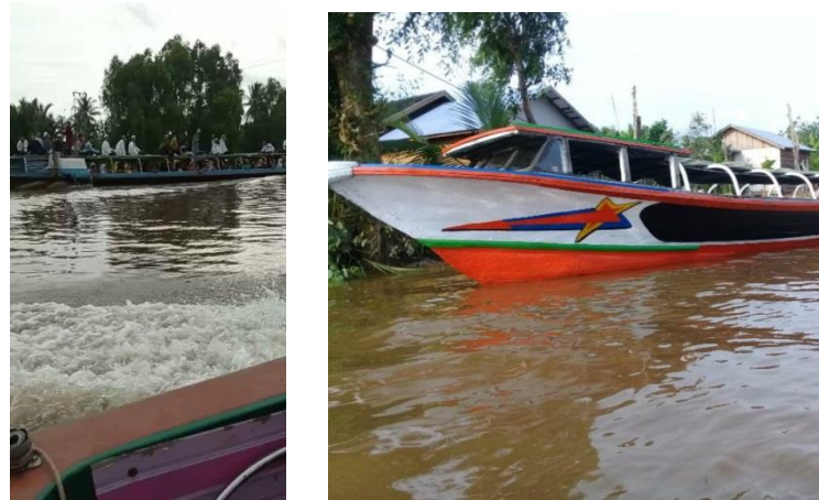
GAMBAR 4.6 Transportasi air yang digunakan

Dari hasil wawancara diatas bisa dilihat bahwa antusias masyarakat luar Desa Tanipah sangat besar untuk mengikuti kegiatan salah satunya dengan menyewa taksi atau transportasi air yang bisa menampung banyak orang bahkan satu buah taksi tersebut tidak cukup untuk membawa semua masyarakat yang ingin berhadir dengan terpaksa hanya sebagian saja yang bisa ikut berhadir.