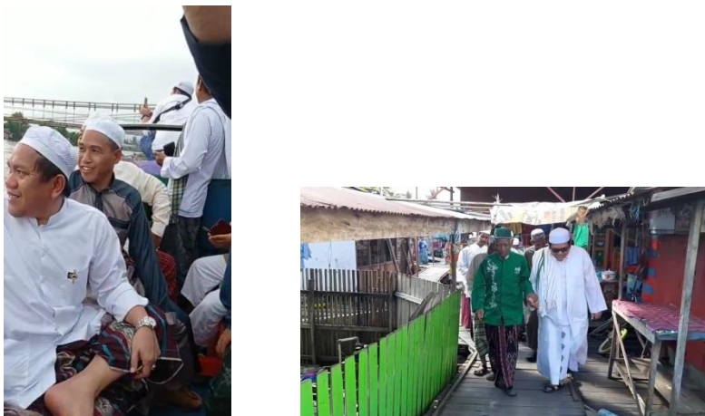
GAMBAR 4.7 Penceramah yang diundang