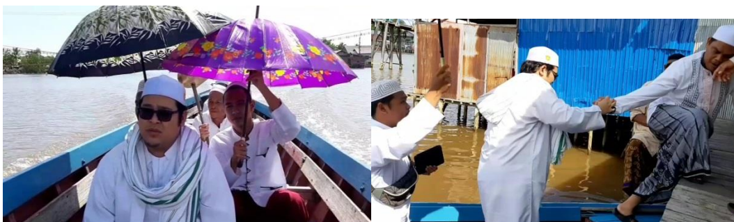
GAMBAR 4.8 Antar jemput penceramah menggunakan transportasi air