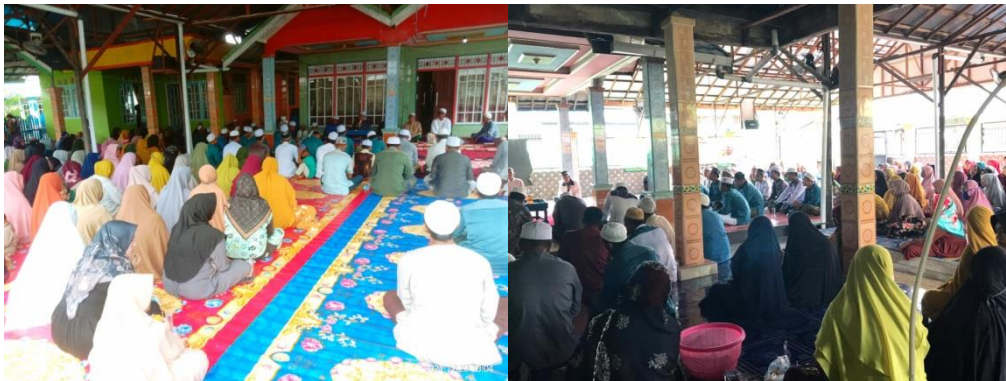
GAMBAR 4.2 Pengajian Rutin Majelis Taklim Al-Anwar