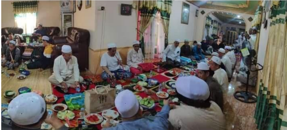
GAMBAR 4.8 Suasana makan bersama penceramah