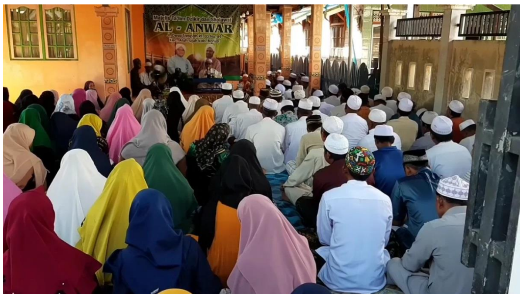
GAMBAR 4.1 Majelis Taklim Al-Anwar