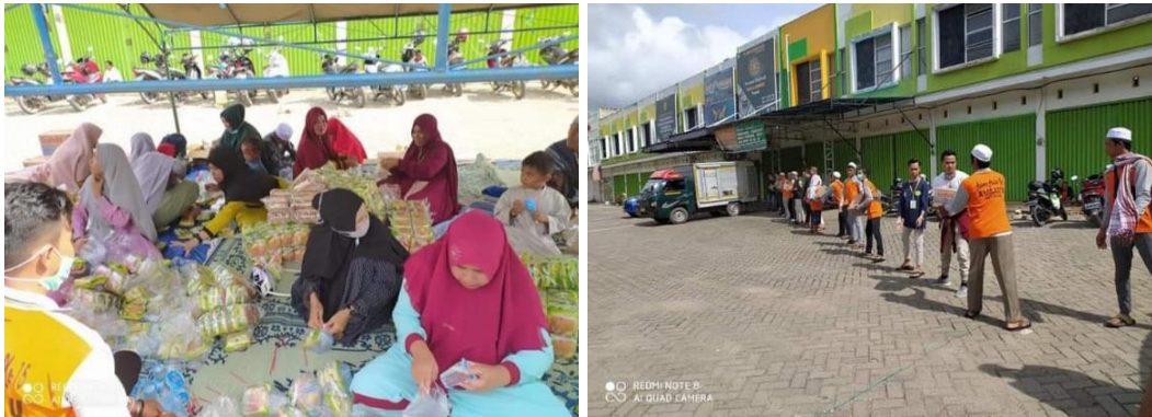
GAMBAR 4.4 Pembagian roti di Martapura yang dilaksanakan Majelis Taklim Al-Anwar