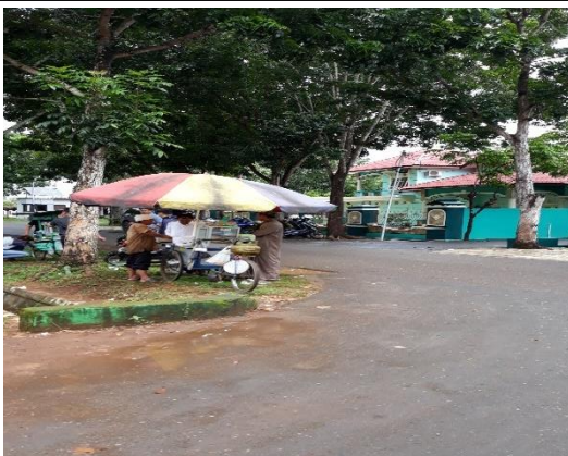
V. "Dikelilingi akses jalan keluar dari 4 penjuru"