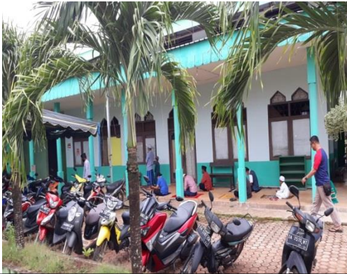
I. "Keadaan masjid didukung oleh aula masjid"