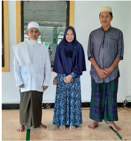
Foto bersama dengan Ketua dan Bendahara Masjid Besar Al-Manar Pelaihari