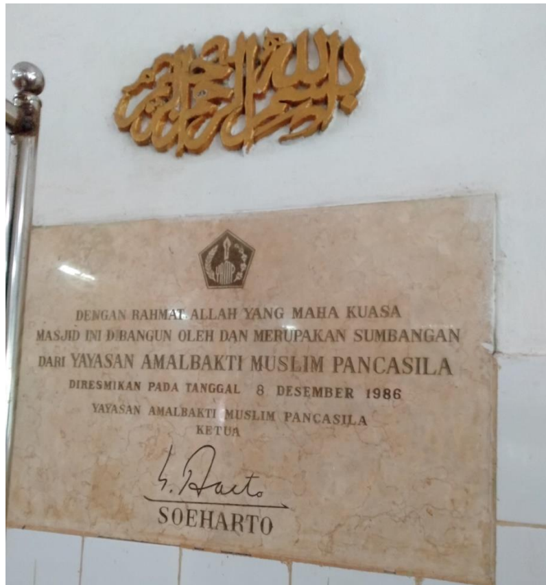
Plakat Masjid Besar Al-Manar Pelaihari