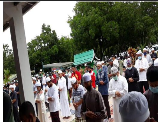
VI. "Halaman depan hingga ke jalan"