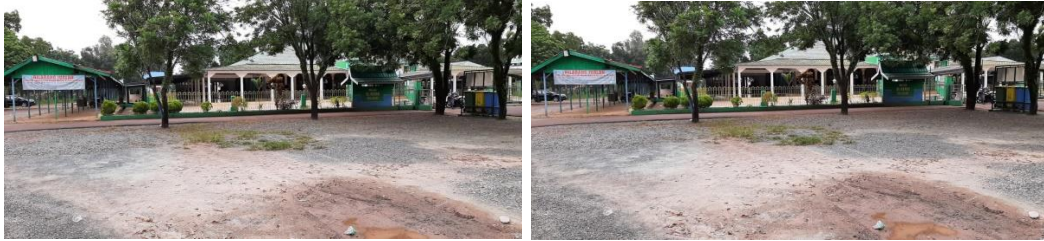
Bagian Kiri Masjid Besar Al-Manar Pelaihari