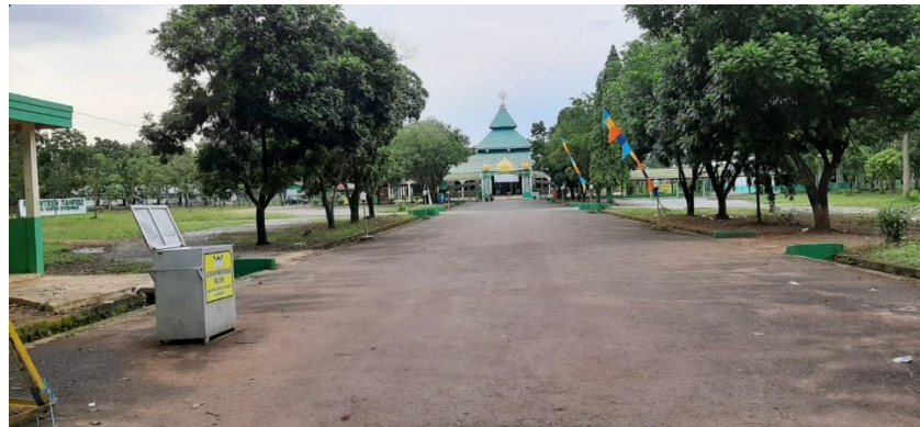
Bagian Depan Pintu Masuk Masjid Besar Al-Manar Pelaihari