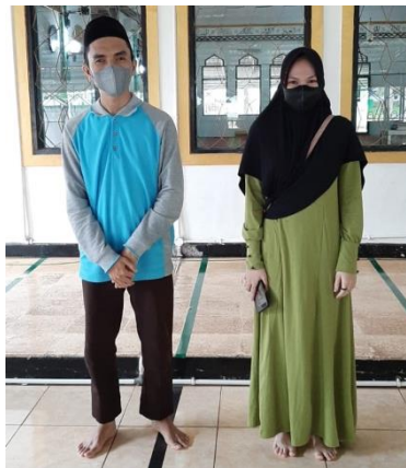
Foto Bersama Jemaah Masjid Besar Al-Manar Pelaihari