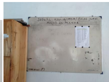
Jadwal Pelaksanaan Shalat Jumat