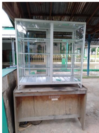
Etalase Jumat Berkah