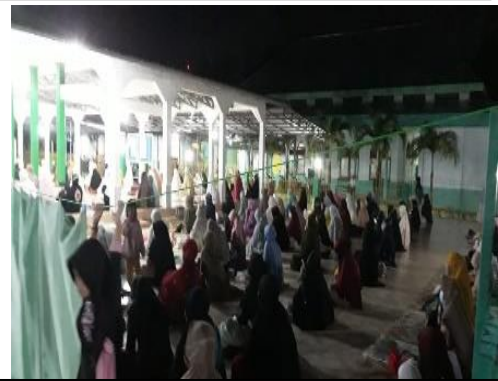
II. "Keadaan malam Jum'at bagian depan masjid"