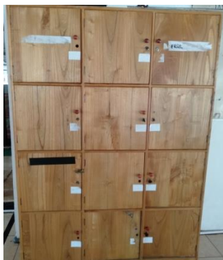
Loker Penitipan Barang