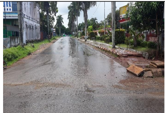
IV. "Akses jalan masuk mudah dari jalan utama"