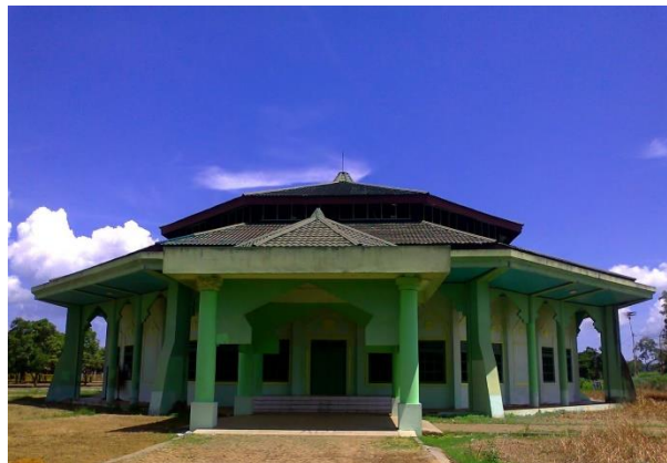
Islamic Center Masjid Besar Al-Manar Pelaihari