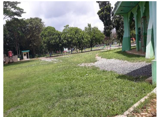
II. "Dukungan dengan keberadaan Islamic center"