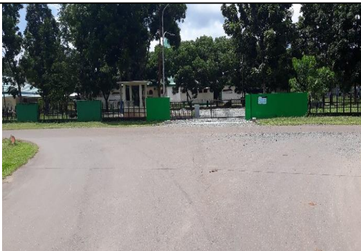
III. "Akses masjid tempat transit daerah lain"