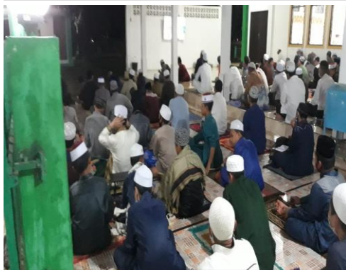
I. "Keadaan pengajian malam Jum'at diteras"