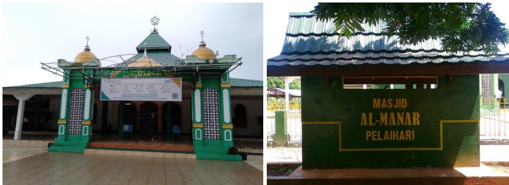
Gambar Depan Masjid Besar Al-Manar Pelaihari