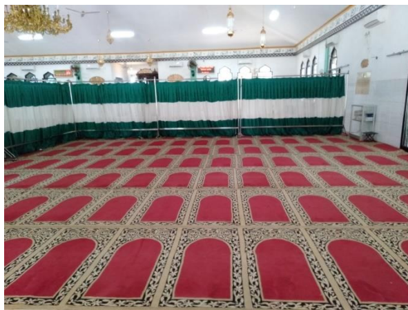
Bagian Saf Wanita