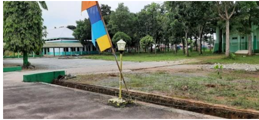
Bagian Samping Kanan Halaman Masjid Besar Al-Manar Pelaihari