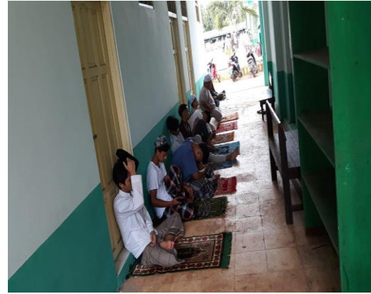
IV. "Bagian aula digunakan saat sholat Jum'at"