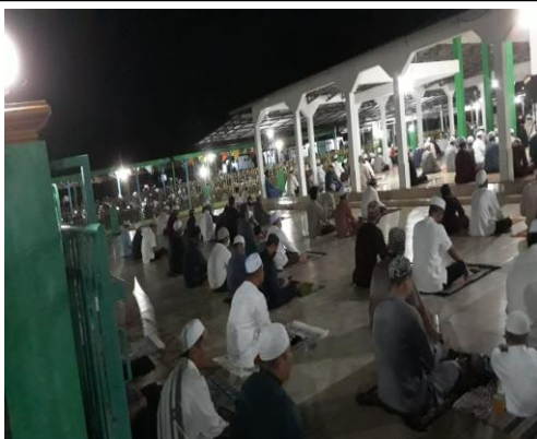
V. "Jemaah meluber kedepan teras masjid"