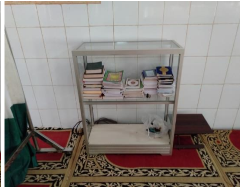
Etalase Bahan Bacaan