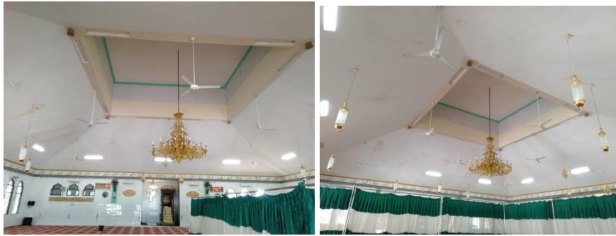
Bagian Plapon Masjid Besar Al-Manar Pelaihari