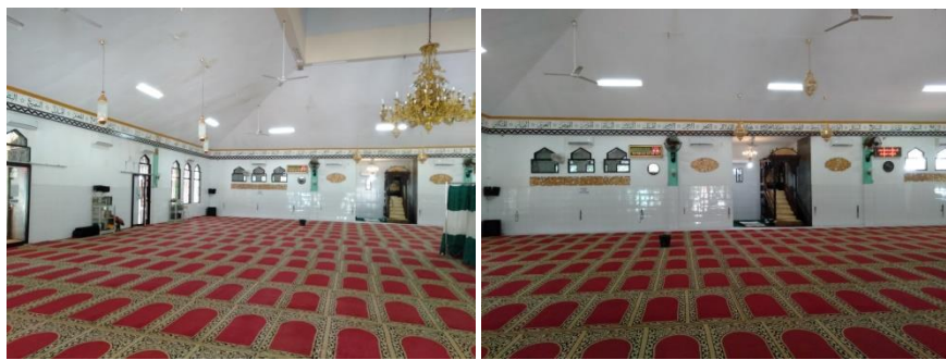
Ruang Utama Masjid Besar Al-Manar Pelaihari