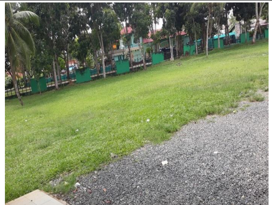
VI. "Halaman luas memudahkan tatakelola"