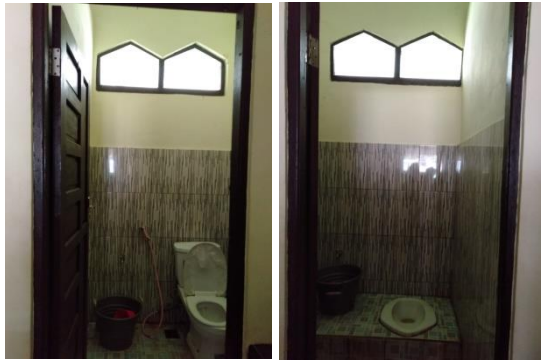
Tempat Wudu dan Toilet Luar