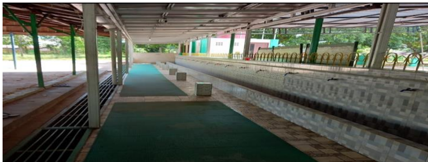
Dokumentasi Bersama Informan