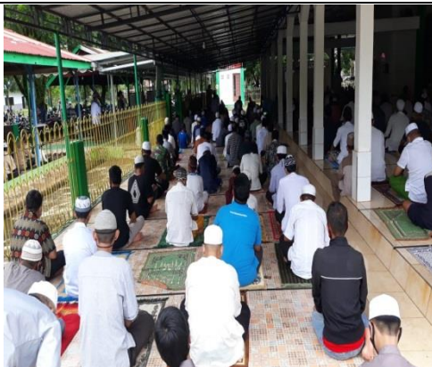
III. "Teras hingga ke tempat parkir penuh"