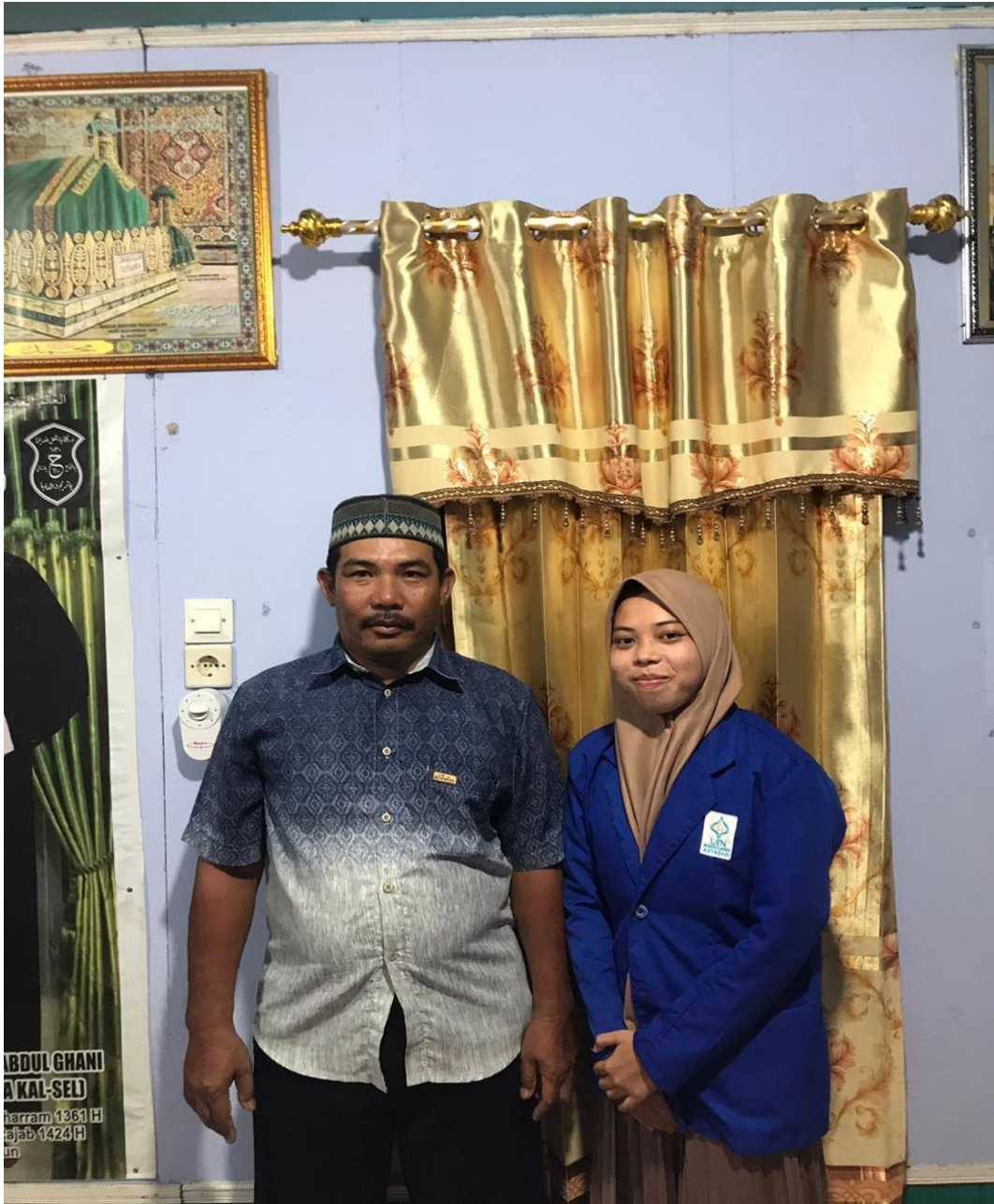
Foto bersama kepala Desa Kuin Besar Kecamatan Aluh-aluh Kabupaten