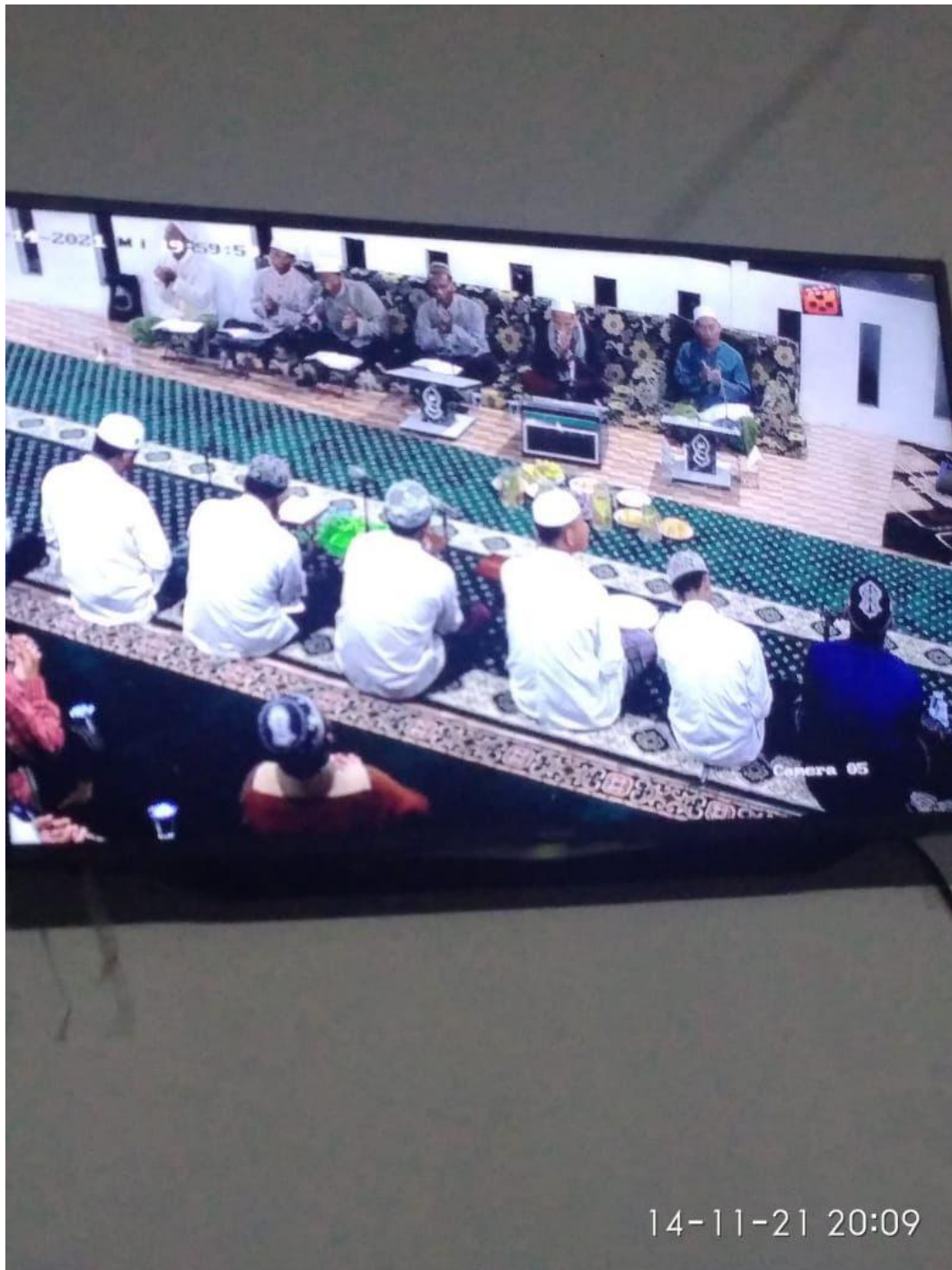
Pergi melaksanakan Maulid Habsyi di mejlis ta'lim Raudatul Anwar