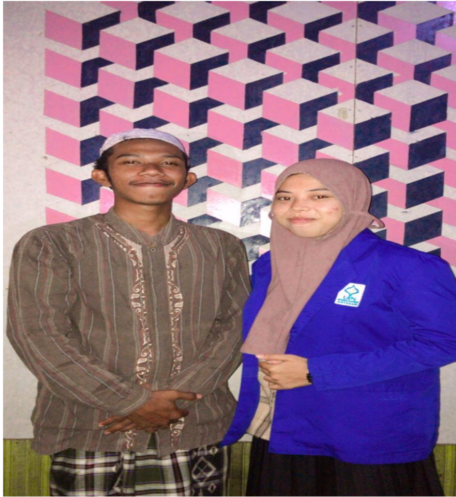
Foto wawancara penulis dengan remaja yang mengikuti aktivitas dakwah Ustaz