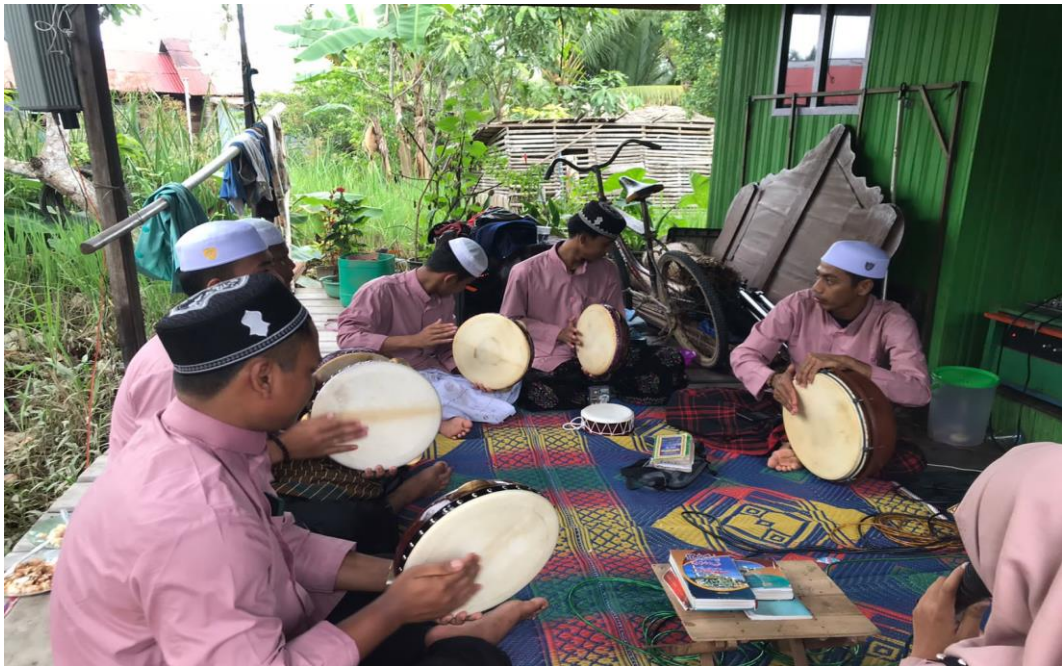
Foto penulis ketika mengikuti kegiatan keagamaan Maulid Habsyi kepada para remaja