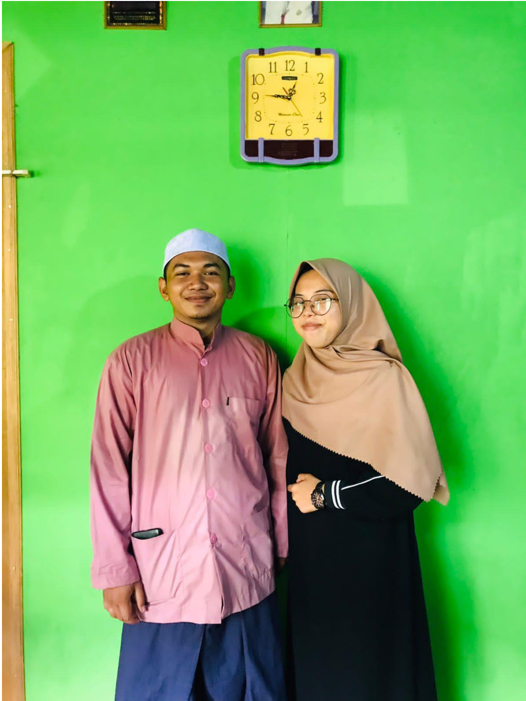
Foto wawancara penulis dengan remaja yang mengikuti aktivitas dakwah Ustaz