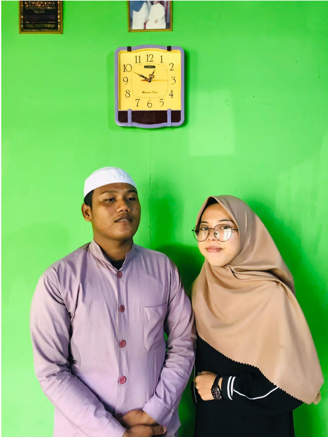
Foto wawancara penulis dengan remaja yang mengikuti aktivitas dakwah Ustaz