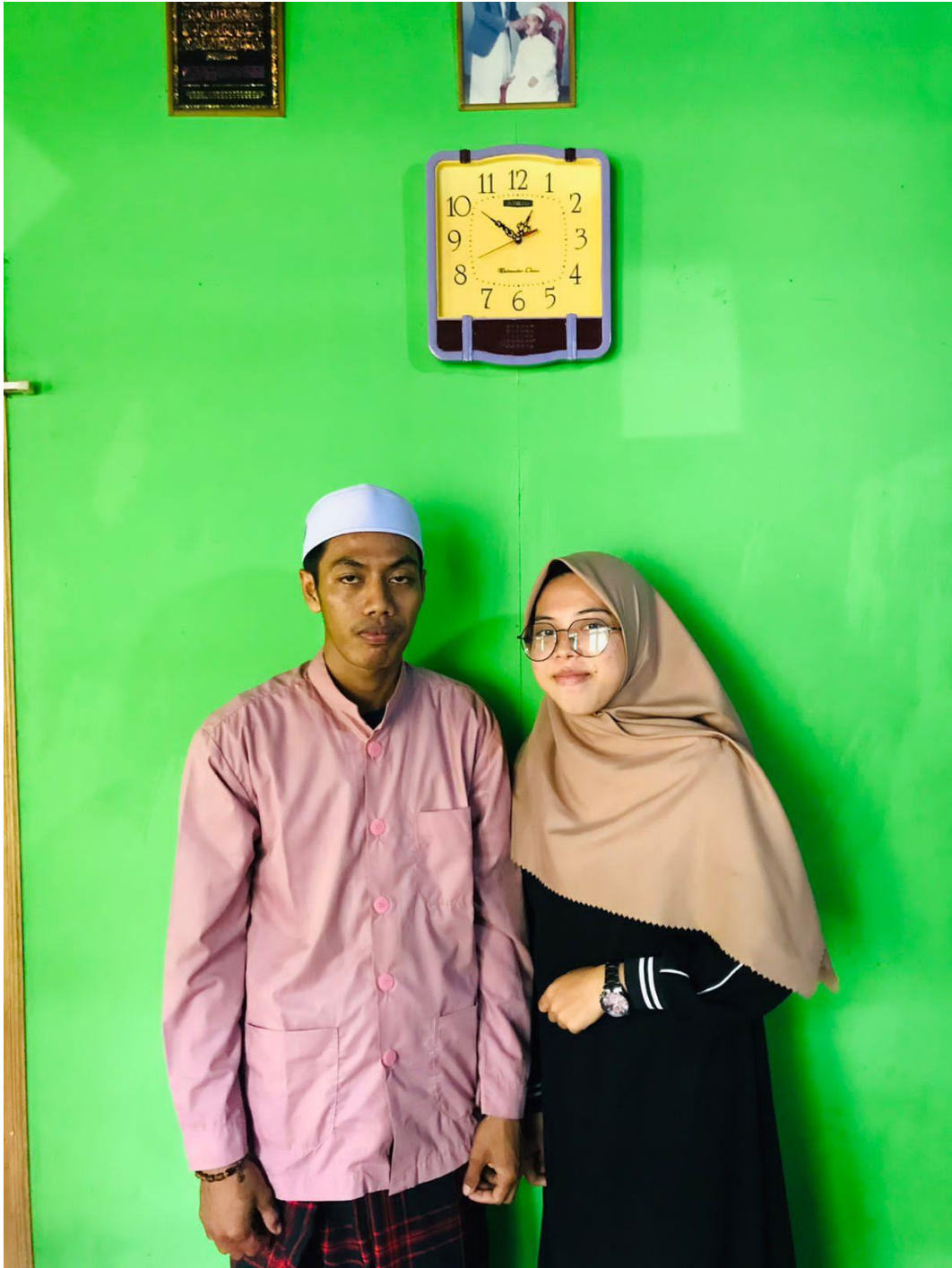
Foto wawancara penulis dengan remaja yang mengikuti aktivitas dakwah Ustaz