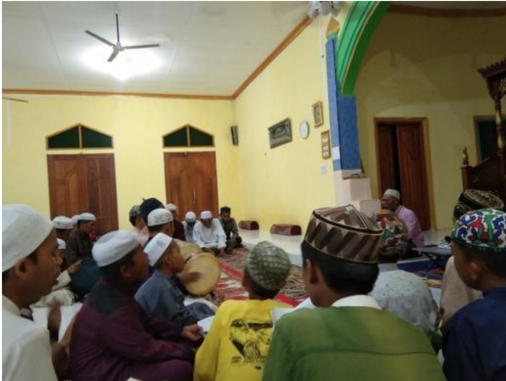
Maulid Habsyi Rutin Setiap Malam Selasa di Mesjid Riyadussolihin di Desa Kuin Besar Kecamatan Aluh-aluh Kabupaten Banjar.