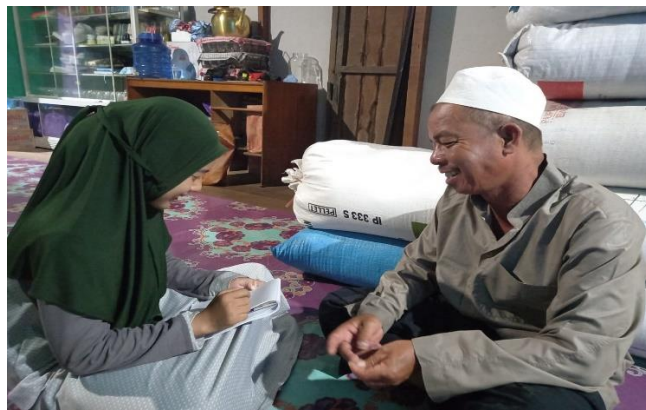
Wawancara dengan Guru Hasbullah