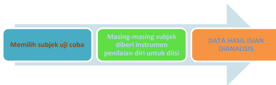
Gambar. 3.2 Diagram Alur Desain Uji Coba Alat Ukur

Desain atau rancangan tryout /uji coba pada penelitian ini ditunjukkan oleh gambar berikut berikut :