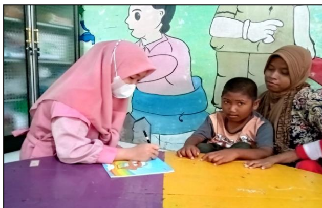
(CD5: Penulis melakukan wawancara dengan orang tua siswa)

Berdasarkan hasil dari wawancara dan observasi yang telah dijabarkan diatas, peneliti menyimpulkan bahwa prinsip individualisasi dalam pembelajaran bagi tunagrahita di Baruh Jaya telah terlaksana dengan baik. Guru melaksanakan prinsip individualisasi di tiap pertemuan pembelajaran. Isi maupun cara penyampaian materi disesuaikan dengan kemampuan dan karakteristik siswa terutama untuk anak tunagrahita.