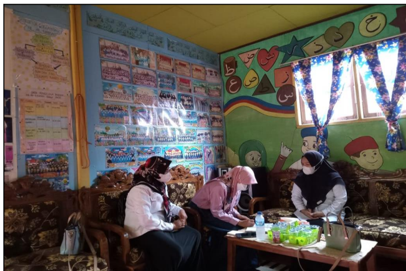
(DC6: penulis melakukan wawancara dengan guru)

yang lebih dipimpin oleh guru atau diarahkan oleh guru. Secara umum pembelajaran kooperatif dianggap lebih diarahkan oleh guru, di mana guru menetapkan tugas dan pertanyaan-pertanyaan serta menyediakan bahan-bahan dan informasi yang dirancang untuk membantu siswa menyelesaikan masalah yang dimaksudkan.