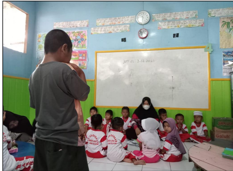
(DC8: Guru melakukan pembelajaran secara kooperatif)

memberikan informasi terkait kemampuan individu, sedangkan tes kelompok memberikan informasi terkait kemampuan tiap kelompok”(CWG9). 64