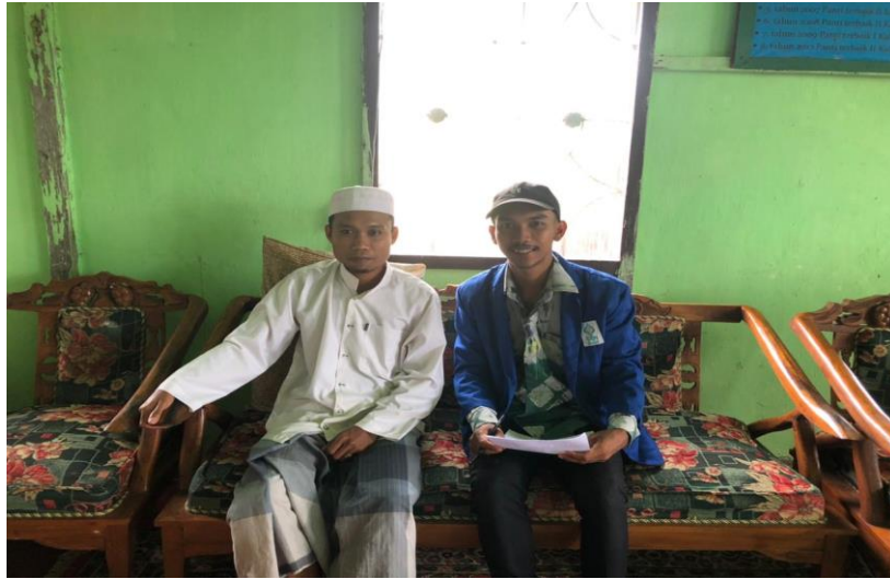
Poto Bersama Pengasuh Panti Asuhan Harapan Kita