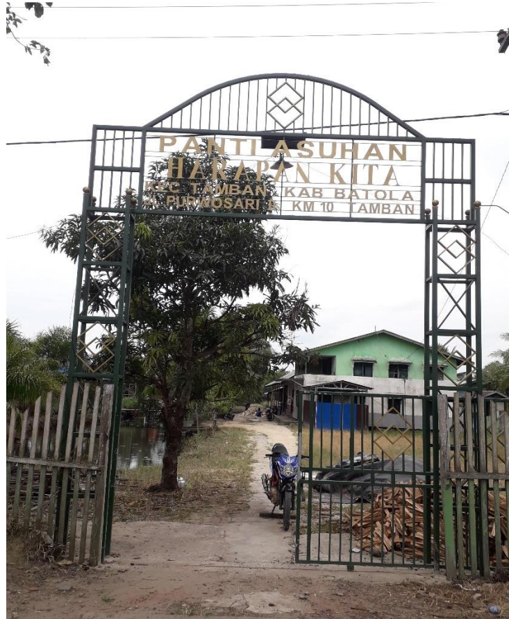
Pintu Gerbang Panti Asuhan Harapan Kita