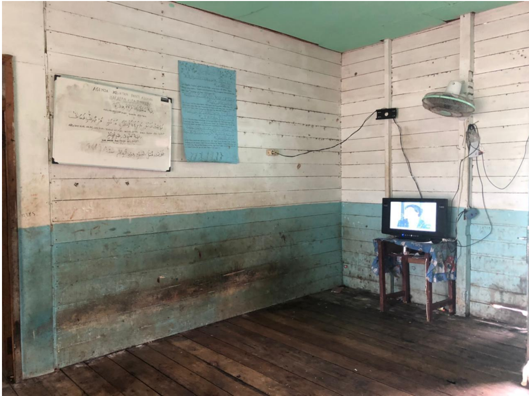
Ruangan Nonton TV