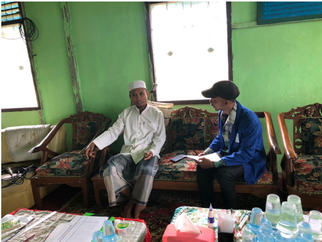
Foto Bersama Penulis Dengan Pengasuh Panti Asuhan