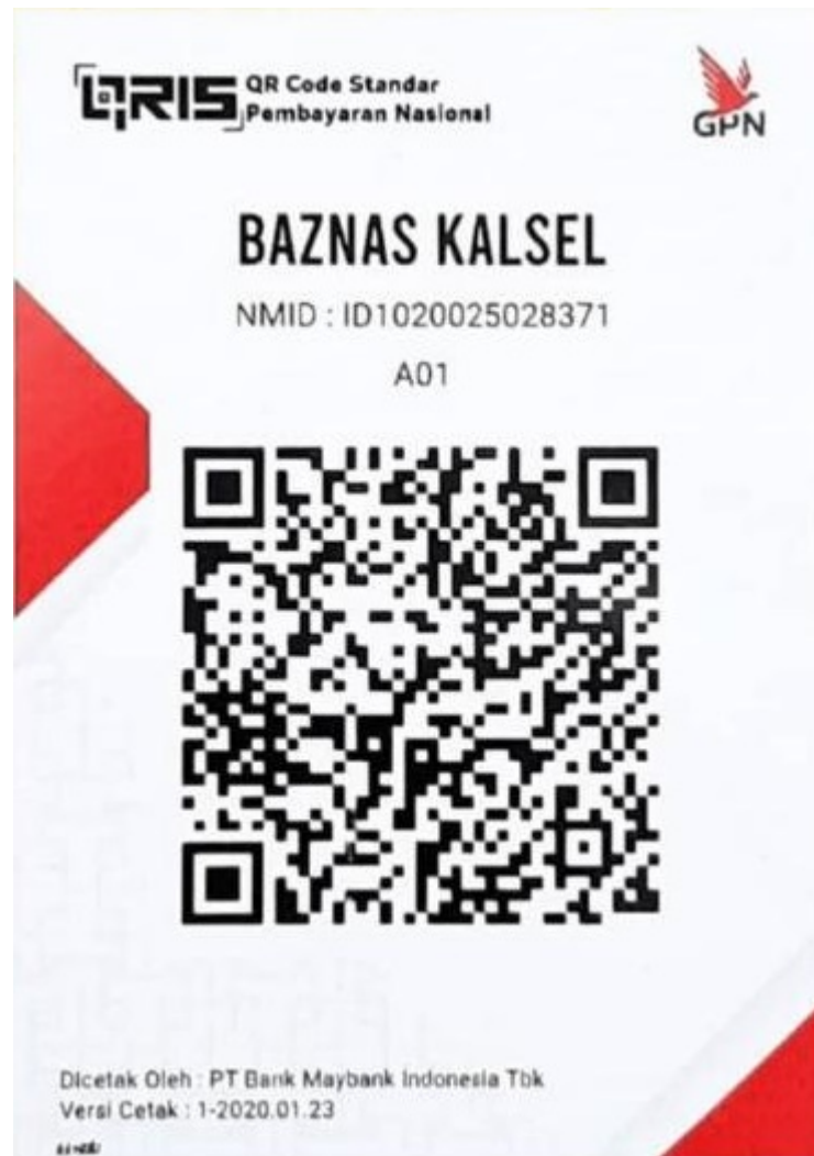
Gambar 4. 1 QR Code BAZNAS Kalimantan Selatan