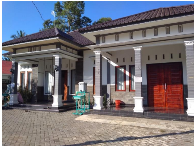
Disamping rumah beliau ini adalah rumah yang sudah di renovasi yaitu untuk tempat jemaah, khususnya jemaah wanita.