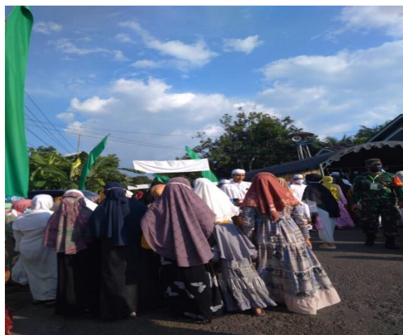
Ini suasana waktu acara haulan di Majelis Taklim sabilal muhtadin.