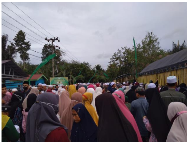
Suasana Peringatan Maulid Nabi Muhammad Saw. 2021