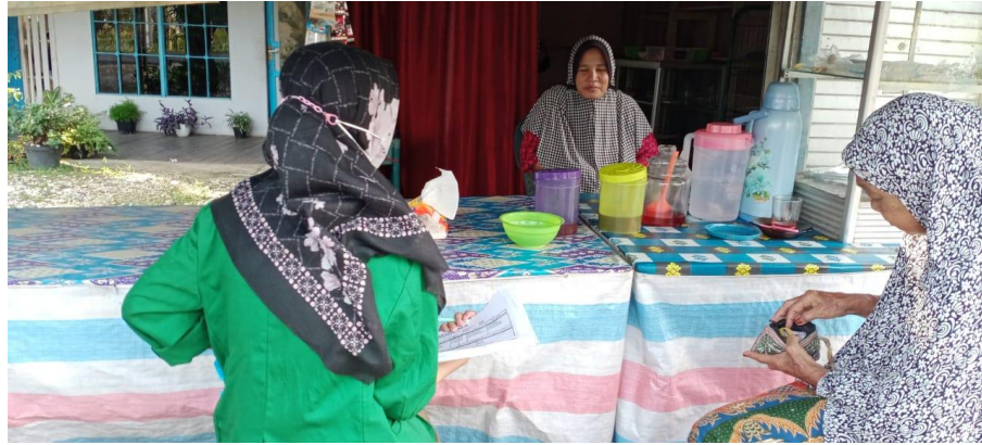
Foto Peneliti Melakukan Wawancara Terhadap Informan