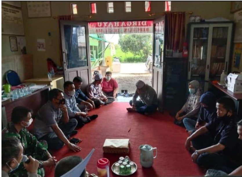
Foto Kegiatan Wawancara Dengan Aparat Desa