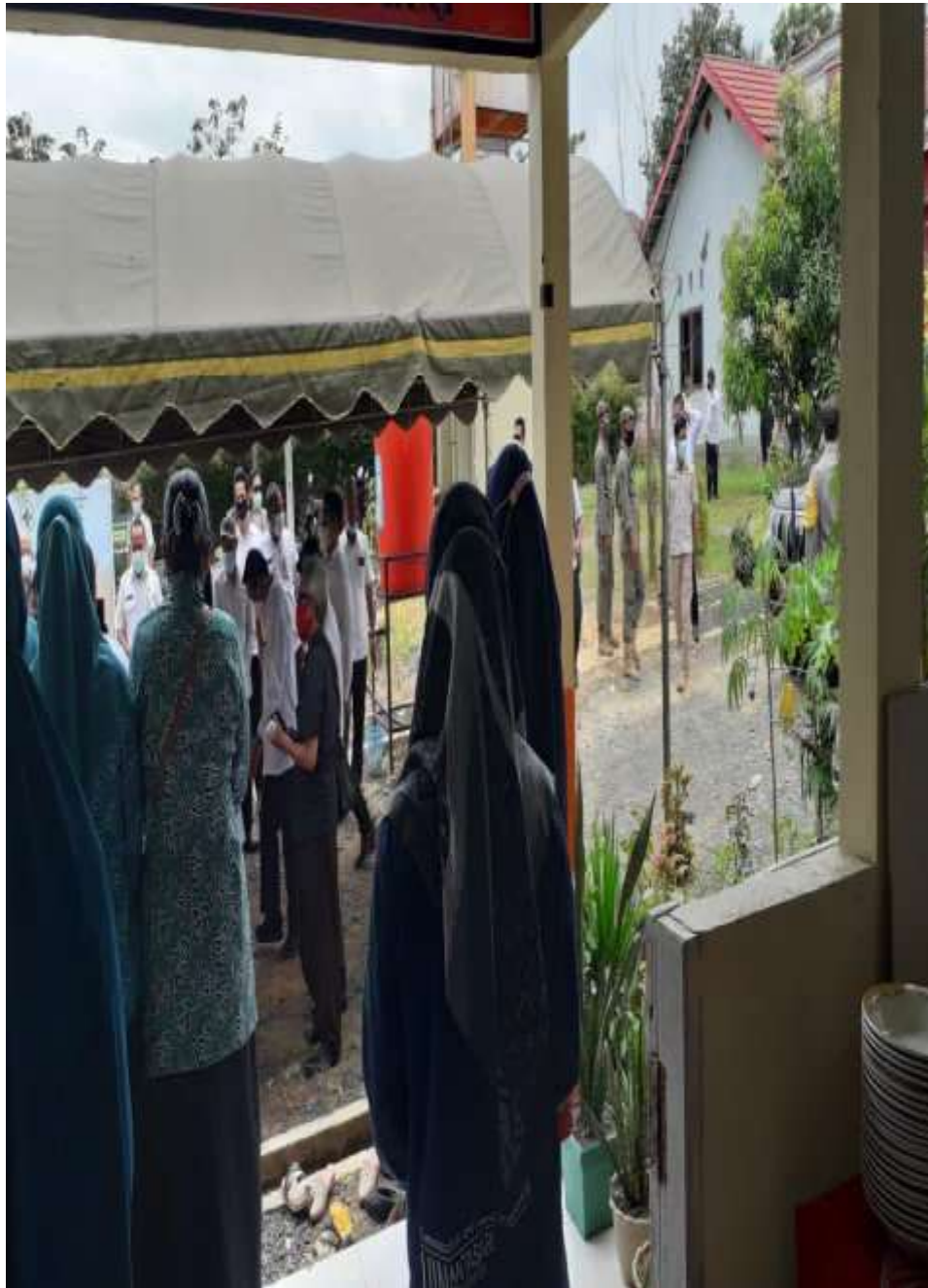
Foto Kegiatan Sosialisasi Tentang Pandemi Covid-19