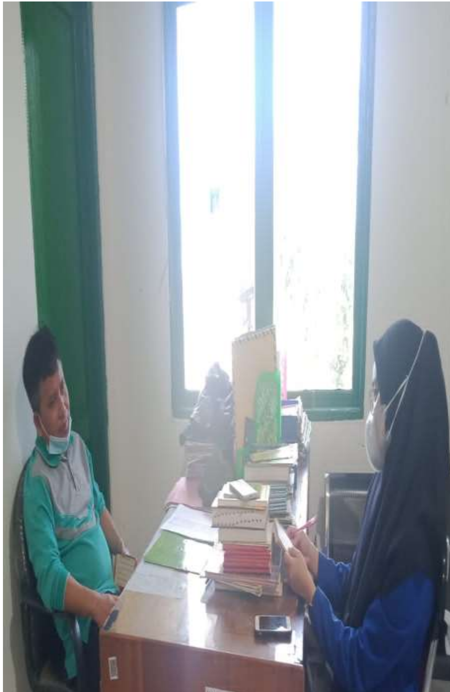
Foto Wawancara dengan Kasi Humas Pemmas dan Kesos