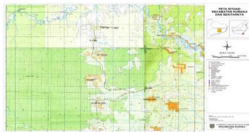
Gambar 4.1 Kondisi Geografis