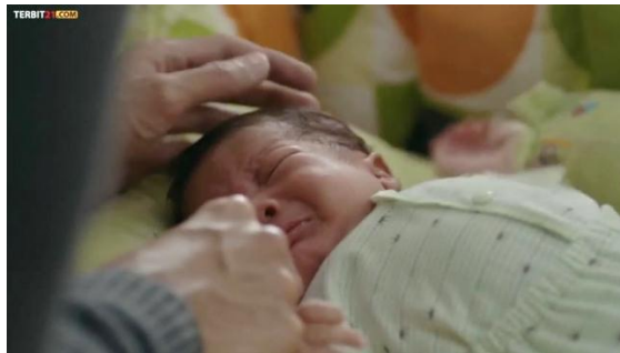
Gambar 4. 3 Adil 1