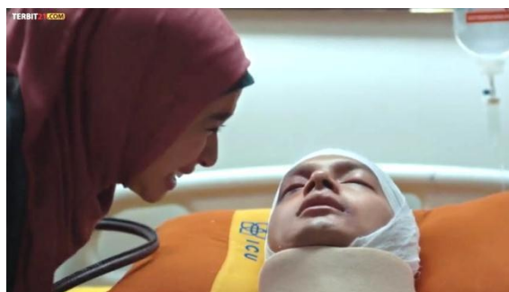
Gambar 4. 5 Pemaaf