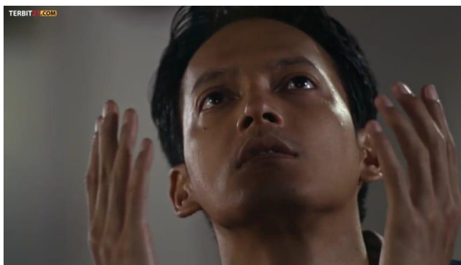
Gambar 4. 6 Berdoa