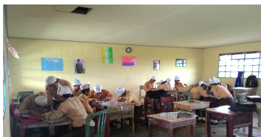
Gambar 4. 1. Aktivitas siswa dalam kelompok

Siswa berdiskusi dengan kelompoknya untuk menyelesaikan tugas yang telah diberikan. Selama siswa berdiskusi, kedua guru berkeliling memantau kegiatan siswa dan membimbing kelompok apabila ada yang mengalami kesulitan.