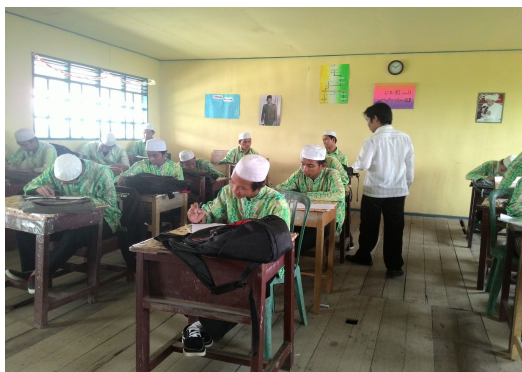
Gambar 4. 3. Aktivitas siswa pada saat berlangsungnya pos tes

Setelah melakukan pembelajaran matematika tipe NHT dan team teaching , maka guna mengetahui perkembangan peningkatan pengetahuan mereka terhadap materi yang telah dipelajari diadakan pos tes pada setiap akhir pertemuan. Dalam mengerjakan pos tes, setiap siswa tidak boleh saling membantu satu sama lain. Keberhasilan kelompok sangat ditentukan oleh kesuksesan individu dalam mengerjakan pos tes tersebut.