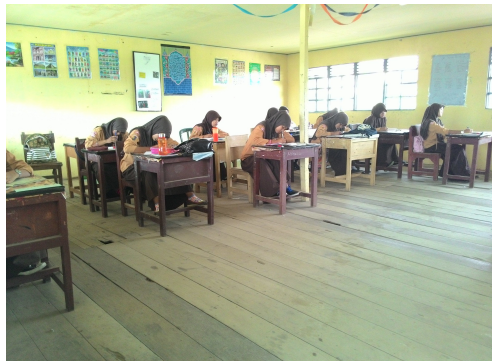
Gambar 4. 3. Aktivitas siswa dalam mengerjakan pos tes