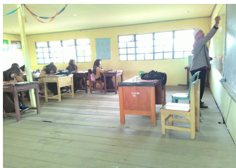
Gambar 4. 2. Penyajian materi oleh guru

membuat keributan. Kemudian guru menenangkan siswa tersebut agar mau memperhatikan kembali. Setelah selesai menyajikan informasi, guru mengadakan tanya jawab dengan siswa untuk mengetahui pemahaman terhadap materi yang telah diberikan. Setelah itu guru memberikan latihan kepada siswa.