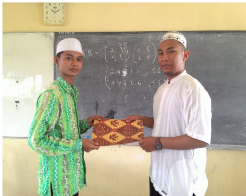
Gambar 4. 4. Aktivitas guru memberikan piagam sebagai penghargaan kepada perwakilan kelompok