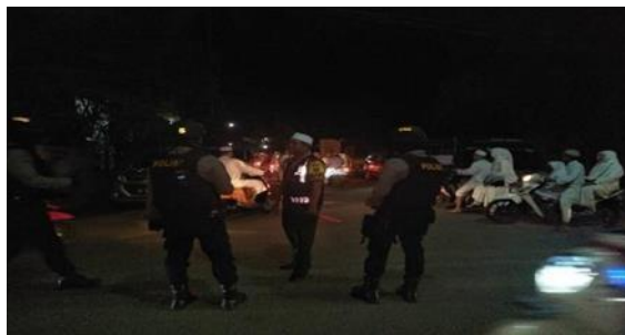
Gambar 4. 5 Pengamanan Saat Majelis Taklim

Analisis penulis pada fungsi actuating di Majelis Taklim Nurul Muhibbin desa kitun kecamatan barabai kabupaten hulu sungai tengah melalui data-data yang diperoleh saling berkesinambungan antara definisi dan pelaksanaan nyata di lapangan, yakni teori penggerakkan M. Munir dan Wahyu yakni pemberian motivasi kerja kepada bawahan, sehingga mereka dapat bekerja dengan ikhlas demi tercapainya tujuan organisasi yang efektif dan efisien