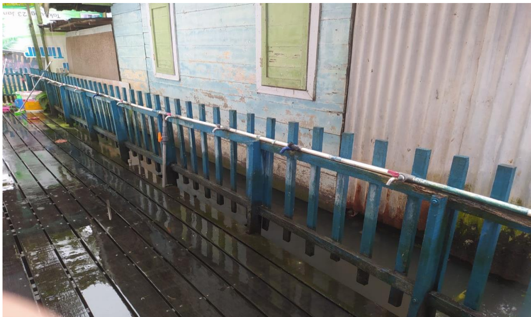
Keadaan tempat untuk melaksanakan kegiatan mencuci tangan dan menggosok gigi