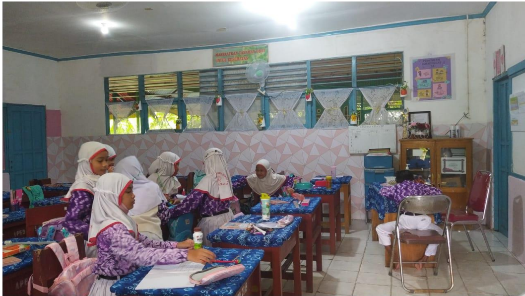
Keadaan Ruang Kelas SDN Kebun Bunga 5 Kota Banjarmasin

Tempat : SDN Kebun Bunga 5 Kota Banjarmasin