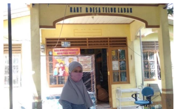
Gambar 6 Kantor Balai Desa Teluk Labak