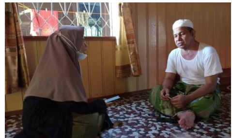
Gambar 3 Wawancara dengan Tokoh Agama/Masyarakat