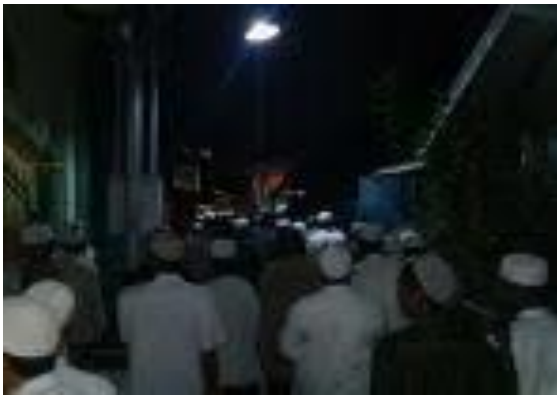
Gambar 2 Pembacaan Burdah dalam ritual tolak bala