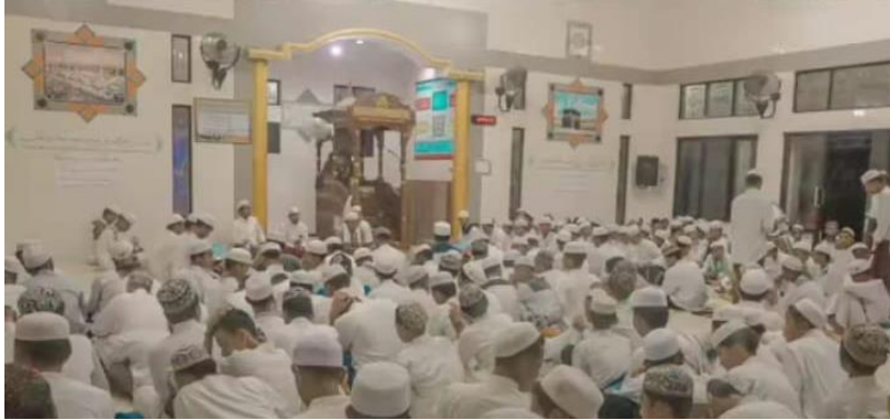
Gambar 1 Membaca Surah Yasin dan doa