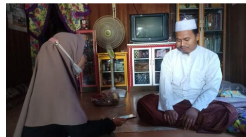
Gambar 5 wawancara dengan tokoh agama/masyarakat