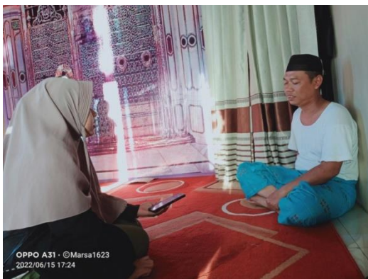
Gambar 4 Wawancara dengan tokoh agama/masyarakat