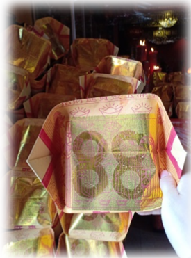
UANG KERTAS SEBAGAI ALAT PERSEMBAHYANGAN