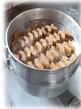
PEMBUATAN KUE BULAN OLEH PARA PENGURUS KLENTENG SOETJI NURANI