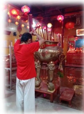
SEJUMLAH PENGANUT TRI DHARMA MELAKUKAN SEMBAHYANG DI MALAM TAHUN BARU IMLEK