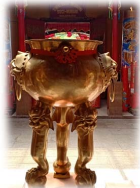
HIOLO SEBAGAI ALAT PERSEMBAHYANGAN