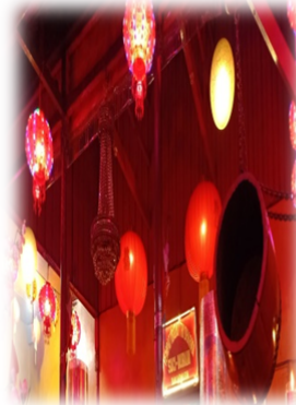
LAMPION DAN BEDUG