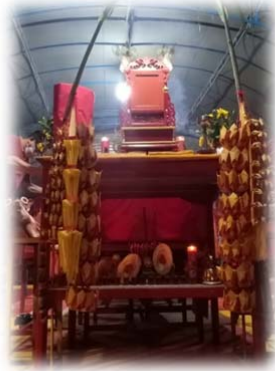
ALTAR PERSEMBAHYANGAN TAMPAK DARI DEPAN