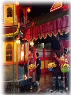
PEMBAKARAN UANG KERTAS SEUSAI SEMBAHYANG TUHAN