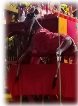
PERSEMBAHAN DAGING KURBAN BERUPA KAMBING