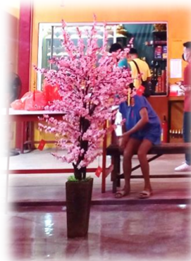
POHON MIE HUA SEBAGAI SIMBOL KEBAHAGIAAN