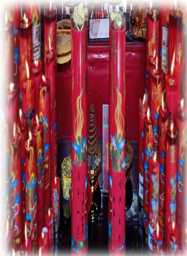
LILIN DI DEPAN ALTAR PER- SEMBAHYANGAN