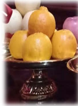
BUAH JERUK SEBAGAI SIMBOL KEBERUNTUNGAN