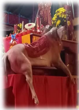
PERSEMBAHAN DAGING KURBAN BERUPA BABI