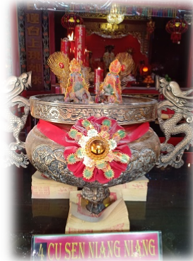
DEWI CU SEN NIANG SEBAGAI DEWI KELAHIRAN