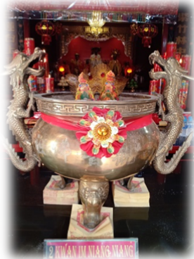
DEWI KWAN IM SEBAGAI DEWI WELAS ASIH