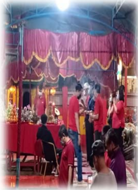
PENGANUT TRI DHARMA MELAKSANAKAN SEMBAHYANG TUHAN