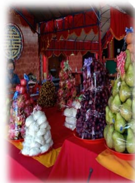
PERSIAPAN MENJELANG SEMBAHYANG TUHAN OLEH PARA PENGURUS KLENTENG