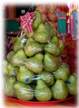
BUAH ALPUKAT HIJAU