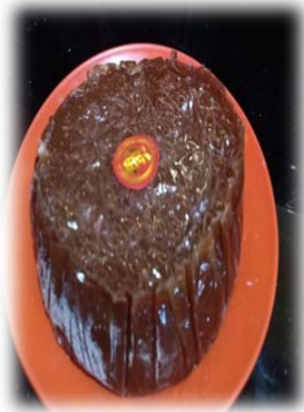
KUE KERANJANG DI TAHUN BARU IMLEK