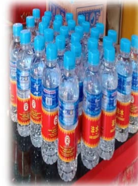
AIR MINERAL SEBAGAI ALAT PER- SEMBAHYANGAN