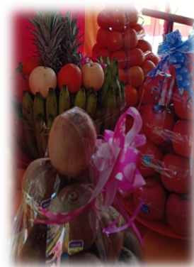
BUAH SAWO, APEL, PISANG, DAN NANAS