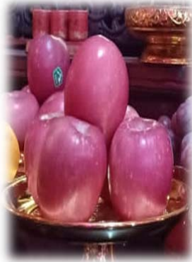
BUAH APEL SEBAGAI SIMBOL KESELAMATAN