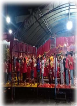
PROSESI SEMBAHYANG TUHAN PADA MALAM TAHUN BARU IMLEK KE-9