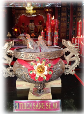
DEWI THIEN SANG SEBAGAI DEWI PELINDUNG