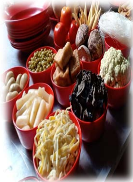
PERSEMBAHAN ANEKA VEGETARIAN