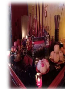
PERSEBAHAN PERSEBAHYANGAN DI ALTAR DEWA