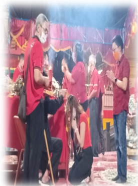
PROSESI PEMBERKATAN PADA SEMBAHYANG TUHAN