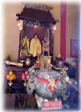
DEWA TRI DHARMA DI KLENTENG SOETJI NURANI