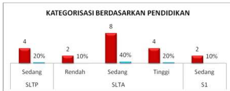
Diagram 3 Self Stigma ODHA Berdasarkan Pendidikan

Diagram 3 di atas menunjukkan bahwa dalam perhitungan kategorisasi berdasarkan pendidikan tingkat SLTA yang mendominasi dan mewakili setiap kategorisasi yang sudah ditentukan oleh peneliti, pada kategori rendah terdapat 2 orang dengan persentase 10%, kategori sedang terdapat 8 orang dengan persentase 40% menduduki posisi terbanyak di tingkat SLTA dan pada kategori tinggi terdapat 4 orang dengan persentase 20% dan menduduki posisi kedua. Jumlah total keseluruhan di tingkat SLTA terdapat 14 orang dengan tingkat kategori berbeda-beda. Pada tingkat SLTP terdapat 4 orang yang semuanya berada pada kategori sedang dengan persentase 20%. Sedangkan pendidikan tingkat S1 ditemukan 2 orang dan keduanya menduduki kategori sedang dengan persentase 10%. Lebih jelasnya dapat dilihat pada diagram di bawah ini.