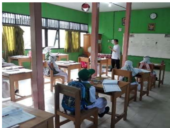
Gambar 4.1 Proses Pembelajaran Tatap Muka di Kelas

Demikian juga menurut ER dan MA, mereka menyatakan bahwa Pembelajaran tatap muka turut meningkatkan semangat belajar anak, karena mereka dapat bertemu dengan teman dan gurunya. Oleh karena itu, mereka bisa mengeksplor apa saja yang mereka dapat secara langsung saat belajar. 79 Hal ini juga dikatakan FI, tentunya Pembelajaran tatap muka dapat meningkatkan semangat anak dikarenakan bisa berinteraksi langsung dengan teman-temannya, proses pembelajaran pun menjadi efektif. 80