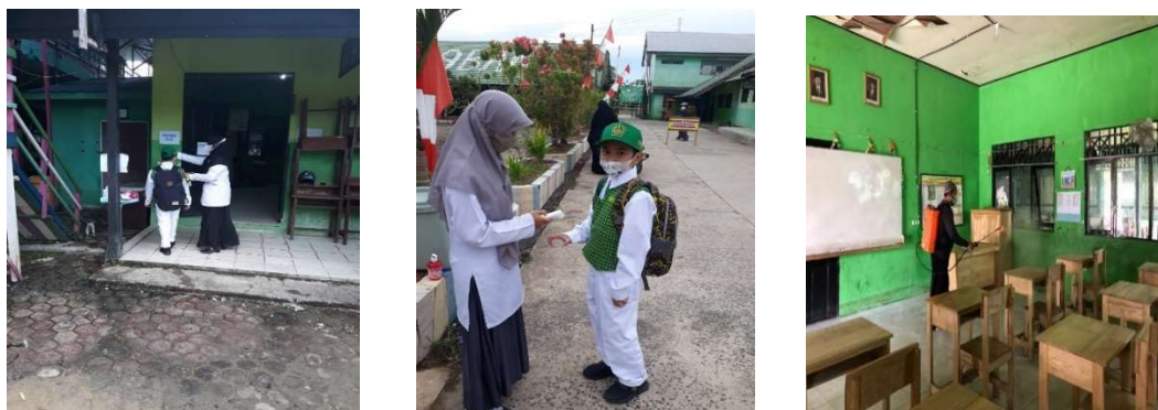
Gambar 4.2 Kelengkapan Alat-alat Protokol Kesehatan

Berdasarkan wawancara dengan RO selaku orang tua yang anaknya bersekolah di MIN 9 Banjar mengatakan, “Lingkungan Sekolah kondusif untuk dilaksanakan Pembelajaran tatap muka serta tersedianya sarana dan prasarana protokol kesehatan yang lengkap”. 84 Begitu juga hal yang dinyatakan oleh RA ketika peneliti menanyakan hal terkait Pencegahan Kerumunan, “dengan tidak memberikan pihak luar (pedagang) untuk memasuki kawasan sekolah.” 85 Selanjutnya, SI menambahkan bahwa “masker medis tersedia untuk anak-anak yang kelupaan membawa masker dari rumah.” 86