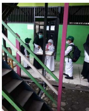
Gambar 4.3 Guru Menginstruksikan Peserta Didik Mencuci Tangan

Persepsi orang tua terhadap guru-guru yang mengajar di sekolah MIN 9 Banjar mengatakan bahwa guru-guru telah melaksanakan protokol kesehatan ketika memberikan pelajaran di dalam kelas. Selanjutnya para orang tua pun berharap agar pembelajaran tatap muka ini berjalan sepenuhnya yaitu 100% karena kasus covid-19 yang sudah melandai dan juga guru-guru sudah melaksanakan vaksinasi untuk pencegahan penularan covid-19. Selanjutnya guru-guru juga turut membimbing siswanya untuk disiplin melaksanakan protokol kesehatan dan mengarahkan siswa untuk beradaptasi dalam pembelajaran tatap muka.