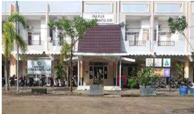
Gambar 4.1 Halaman Sekolah

Adapun salah satu gambaran lingkungan dan ruangan pada SMA Plus Citra Madinatul Ilmi adalah sebagai berikut.