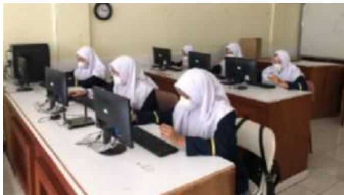
Gambar 4.2 Laboratorium Komputer