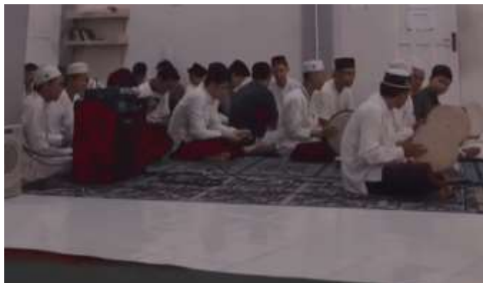
Gambar 4.3 Mushola