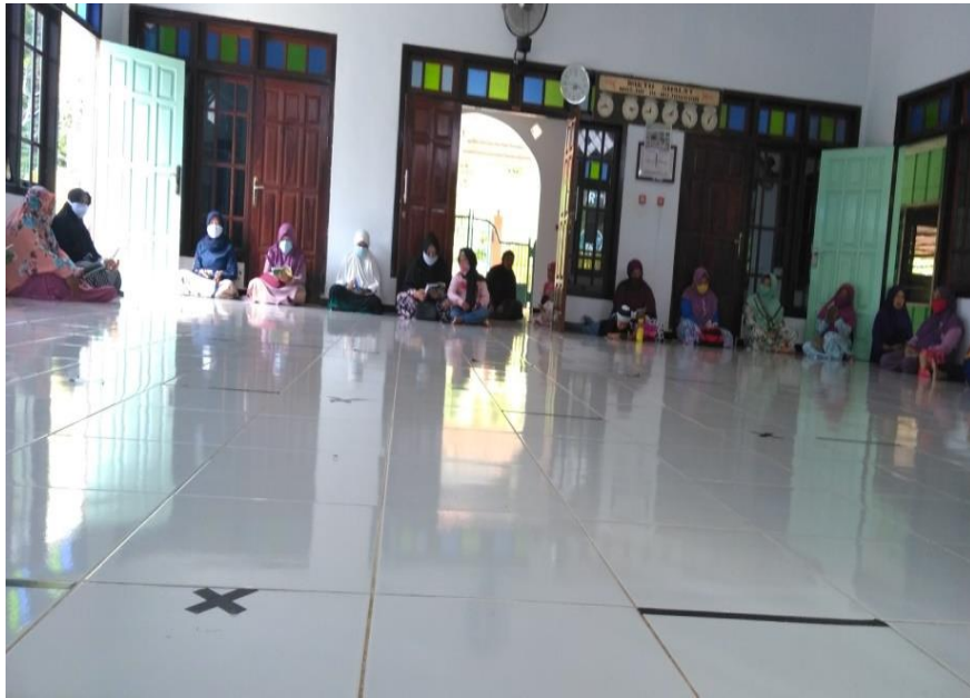
Kegiatan IRMA sebelum pandemi covid-19