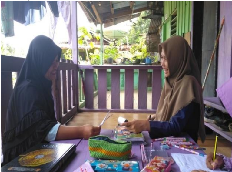
Wawancara jemaah majelis talim sekaligus pengisi pengajian