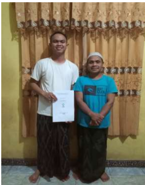
(Dokumentasi Wawancara Bersama Bapak Harto)