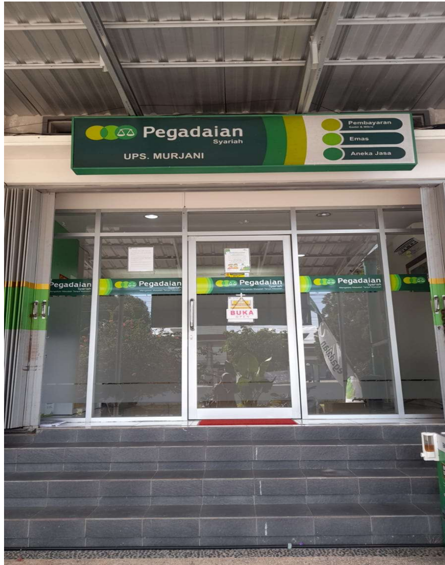
Lokasi Pegadaian Syariah UPS Murjani Banjarbaru