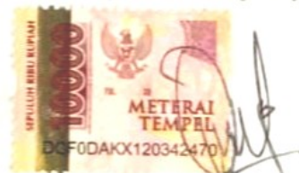
Ajeng Cyntia Azahra

Banjarmasin, 13 Oktober 2022 Yang membuat pernyataan,