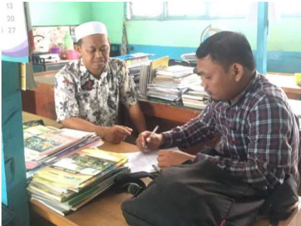
Gambar 2: Wawancara dengan Guru Fiqih Sekolah MTs Al-Istiqamah