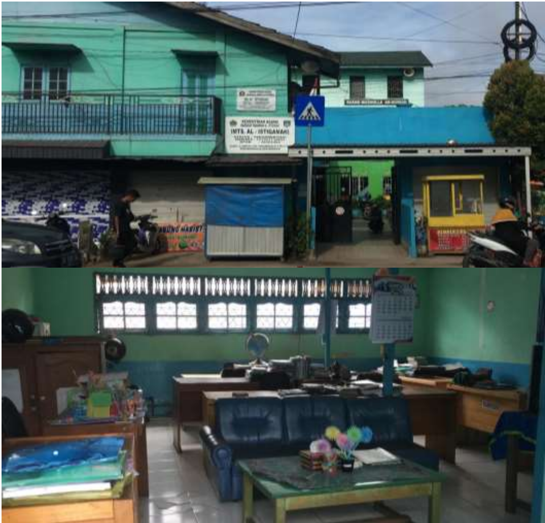
Gambar 5: Keadaan Sekolah MTs Al-Istiqamah