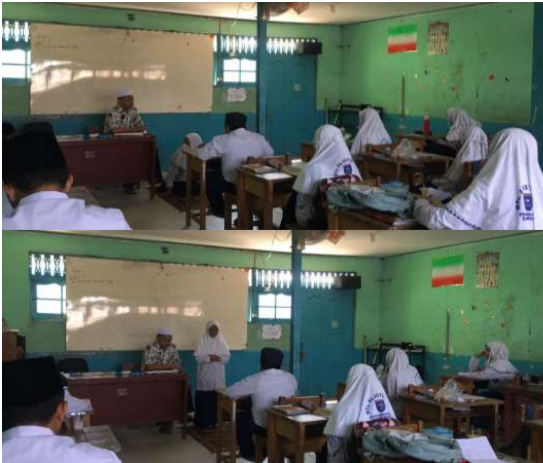
Gambar 4: Kegiatan pembelajaran fiqh Kelas VII MTs Al-Istiqamah