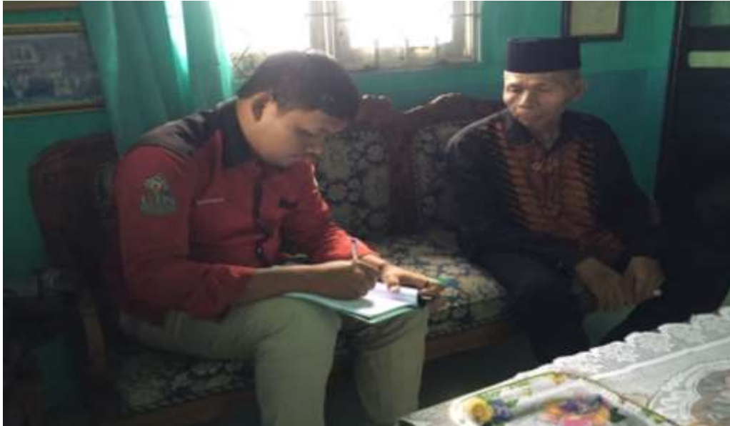
Gambar 1: Wawancara dengan Kepala Sekolah MTs Al-Istiqamah