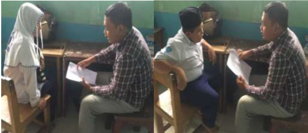
Gambar 3: Wawancara dengan Siswa dan Siswi Sekolah MTs Al-Istiqamah