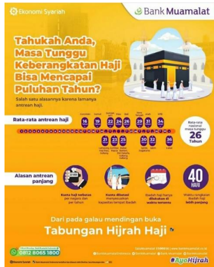
2.6 gambar masa tunggu haji