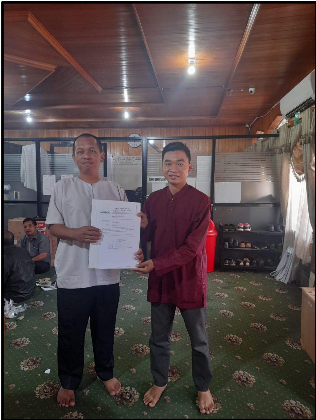
Gambar 1 7 Dokumentasi Penyerahan Surat Selesai Riset