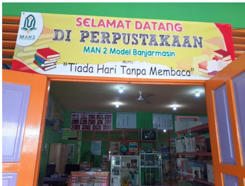
Gambar 4.2 Motto Perpustakaan MAN 2 Kota Banjarmasin