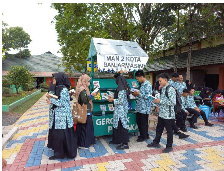
Gambar 4.1 Observasi saat pelaksanaan gerobak pustaka pada acara Bulan Bahasa (01 November 2022)

juga yang membawanya duduk di sekitar taman baca. Buku yang dipajangpun cukup menarik untuk dilihat dan dibaca.