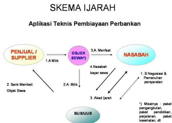
Gambar 4.2 Skema Ijarah