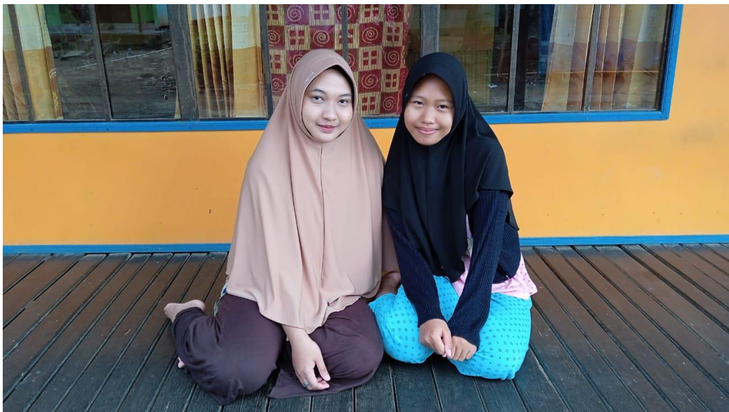
Gambar 10 dokumentasi wawancara dengan anak F