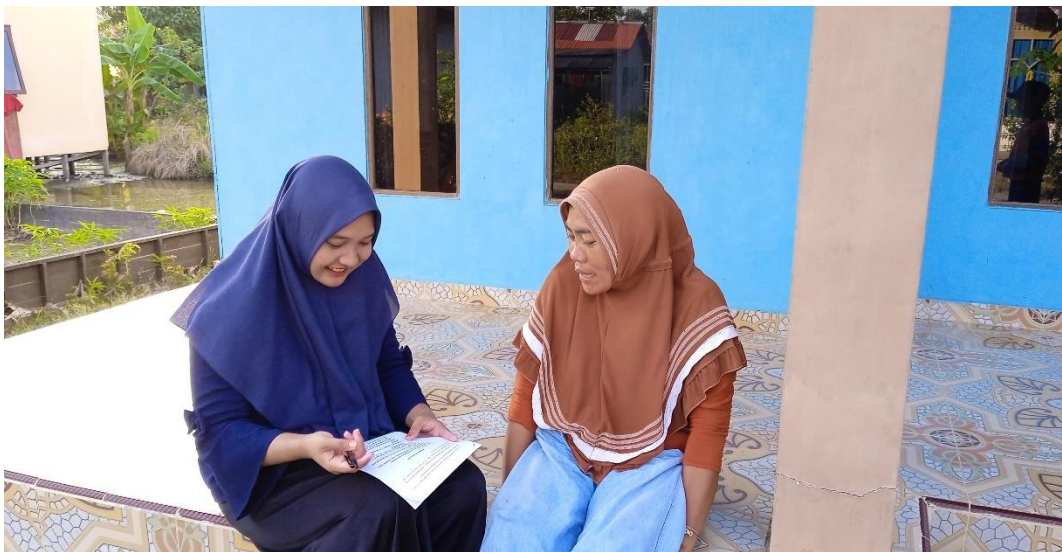
Gambar 5 dokumentasi wawancara dengan ibu N