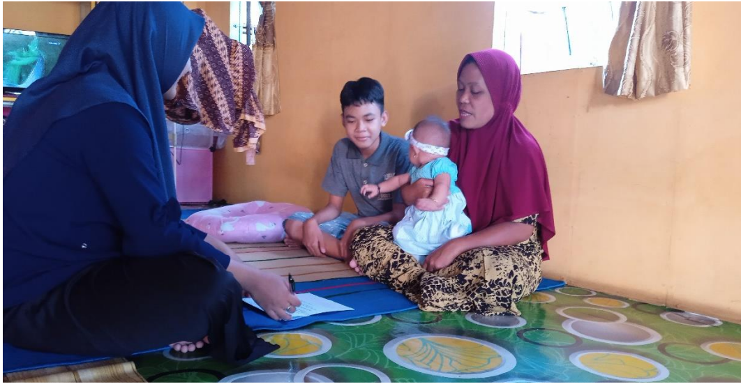
Gambar 4 dokumentasi wawancara dengan Ibu J