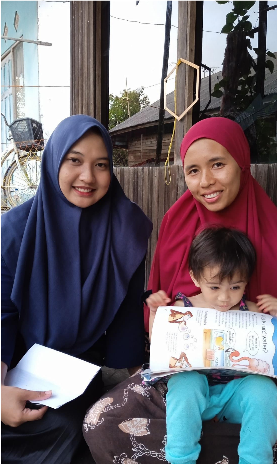
Gambar 6 dokumentasi wawancara dengan ibu H