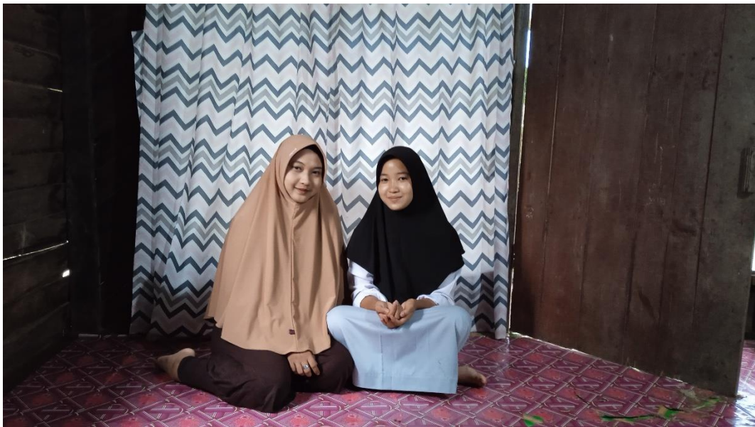
Gambar 8 dokumentasi wawancara dengan anak S