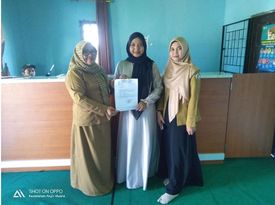
Gambar 1 Dokumentasi Bersama staf Desa Anjir Muara Lama dalam pengantaran surat Riset