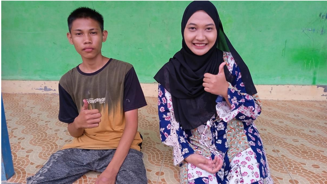
Gambar 7 dokumentasi wawancara dengan anak P