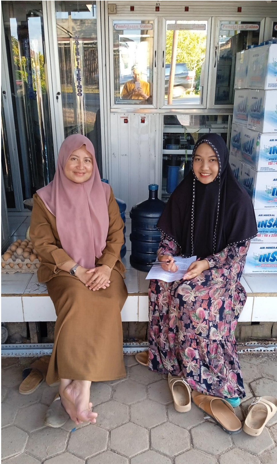
Gambar 3 dokumentasi wawancara dengan ibu I