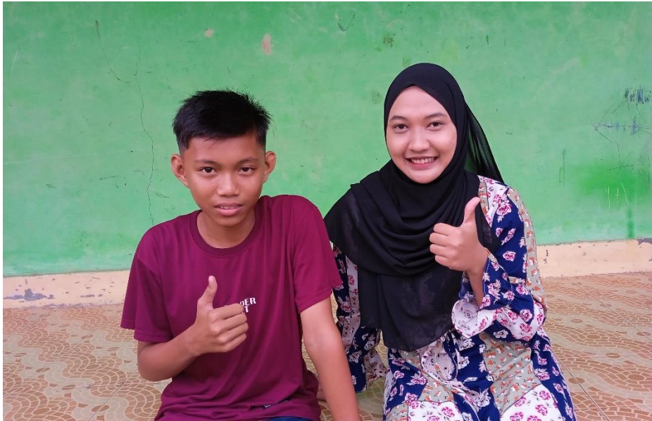
Gambar 9 dokumentasi wawancara dengan anak R