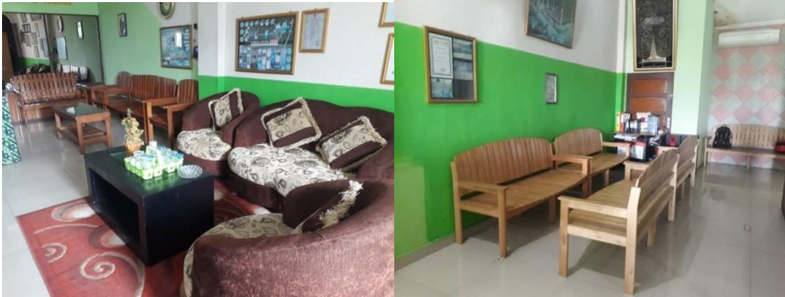
Ruangan Tunggu PT. Noor Thoibah Tour and Travel