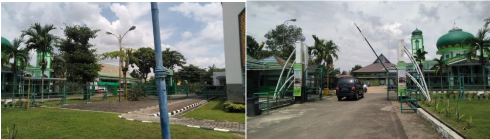
Pintu Gerbang Asrama Haji Kota Banjarbaru