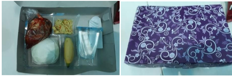
Konsumsi jemaah umrah Di Bandara Internasional Syamsudin Noor