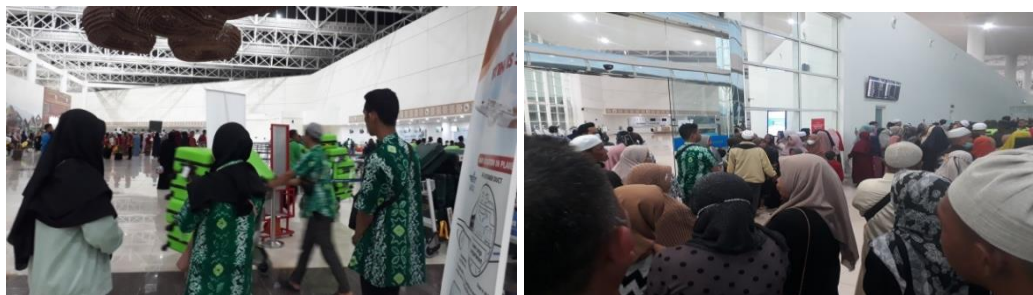
Keberangkatan jemaah umrah Di Bandara Internasional Syamsudin Noor