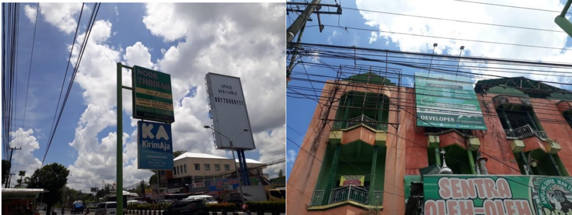
Plang papan nama PT. Noor Thoibah Tour and Travel