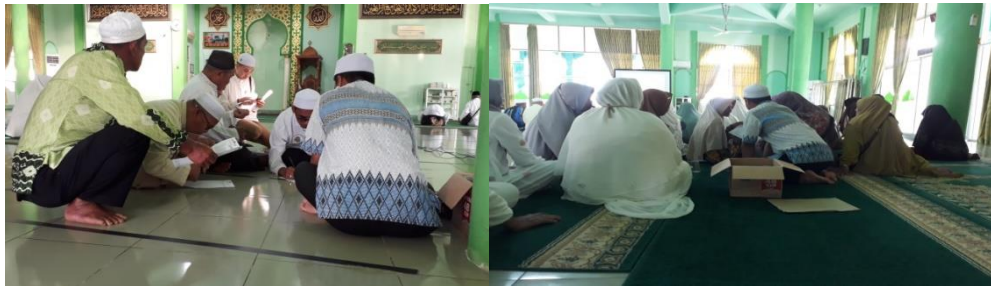
Registrasi jemaah umrah dan konsumsi snack Asrama Haji Kota Banjarbaru