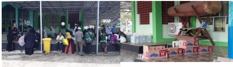
Pembagian konsumsi makan siang jemaah umrah Asrama Haji Kota Banjarbaru