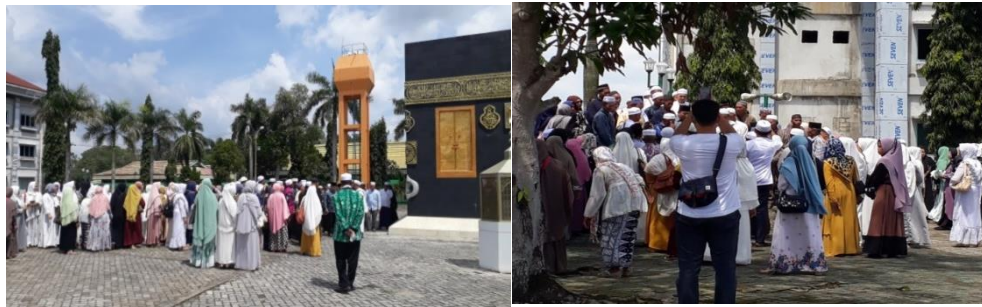
Praktik Outdoor jemaah umrah Asrama Haji Kota Banjarbaru