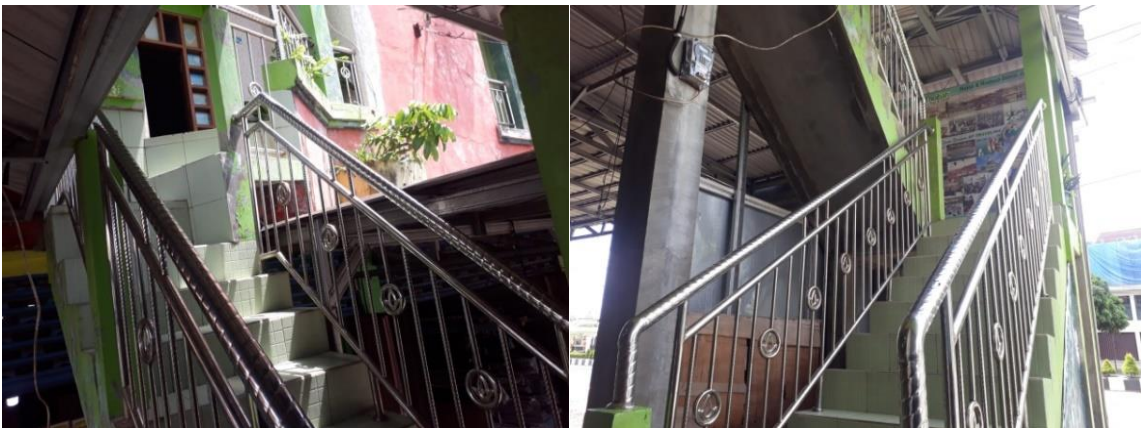
Tangg lt.2 menuju ruangan PT. Noor Thoibah Tour and Travel