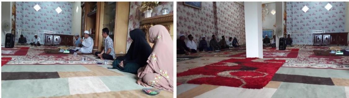
Acara manasik penjelasan Umrah