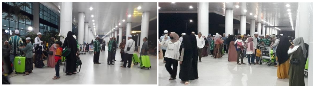
Kedatangan jemaah umrah Di Bandara Internasional Syamsudin Noor