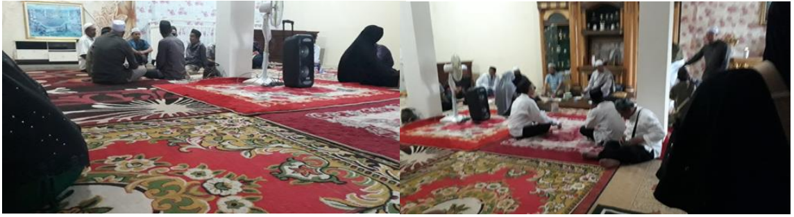
Diskusi setelah makan siang dan sholat ashar Makan Siang Jemaah Umrah