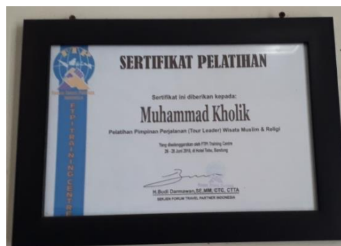
Sertifikat PT. Noor Thoibah Tour and Travel