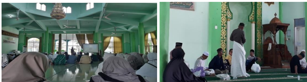
Penjelasan dan praktik jemaah umrah Indor Asrama Haji Kota Banjarbaru