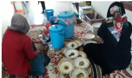
Konsumsi Makan Siang Jemaah Umrah