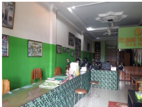
Customer Service PT. Noor Thoibah Tour and Travel